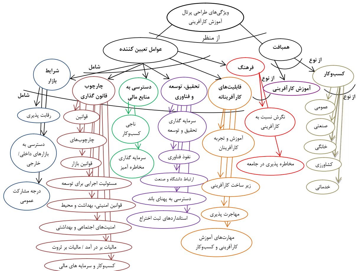
شکل ۲: هستان‌نگار ویژگی‌های همبافت و عوامل تعیین کننده پرتال آموزش کارآفرینی

جدید نیز از جمله مهارت‌های مورد نیاز کارآفرین پس از تاسیس شرکت هستند که به منظور ایجاد انگیزش در بین افراد و ایجاد کارآفرینان جدید، آگاهی دادن، هدایت و تشویق کارآفرینان به سوی کسب مهارت‌های لازم و ارائه آموزش‌های لازم برای کسب مهارت‌های مورد نیاز به کارآفرینان صورت می‌گیرد و گذراندن این دوره‌ها برای موفقیت کارآفرینانی که قبلاً هیچ گونه سابقه و زمینه محیطی لازم برای آنان فراهم نبوده، ضروری است.