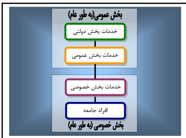
شکل ۱. مدل خدمات الکترونیک پارک‌های مجازی [۲]

انواع خدمات پارک‌های مجازی را می‌توان در دو بخش عمومی (به طور عام) و خصوصی (باز هم به معنای عام آن)، تقسیم‌بندی کرد. توسعه‌ی پارک‌های علمی/ فناوری مجازی در ایران، باید با توجه به این لایه‌ها، و با اولویت‌گذاری بر روی لایه‌های همگانی‌تر صورت پذیرد، ضمن آنکه تعادل نسبی در گسترش توأمان این لایه‌ها اهمیت دارد و نباید از نظر دور بماند. شکل ۱، مدل لایه‌ای ارائه‌ی خدمات را به صورت طیفی از همگانی‌ترین لایه تا شخصی‌ترین لایه، نشان می‌دهد.