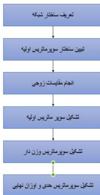
شکل (۲) مراحل روش تحلیل شبکه (ANP)