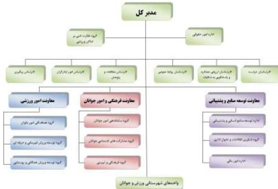
دیاگرام ۴. ساختار سازمانی ادارات کل ورزش و جوانان استان‌ها

ساختار سازمانی ادارات کل ورزش و جوانان استان‌ها از الگوی یکنواختی پیروی می‌کند. این ساختار در دیاگرام ۴ قابل مشاهده است: