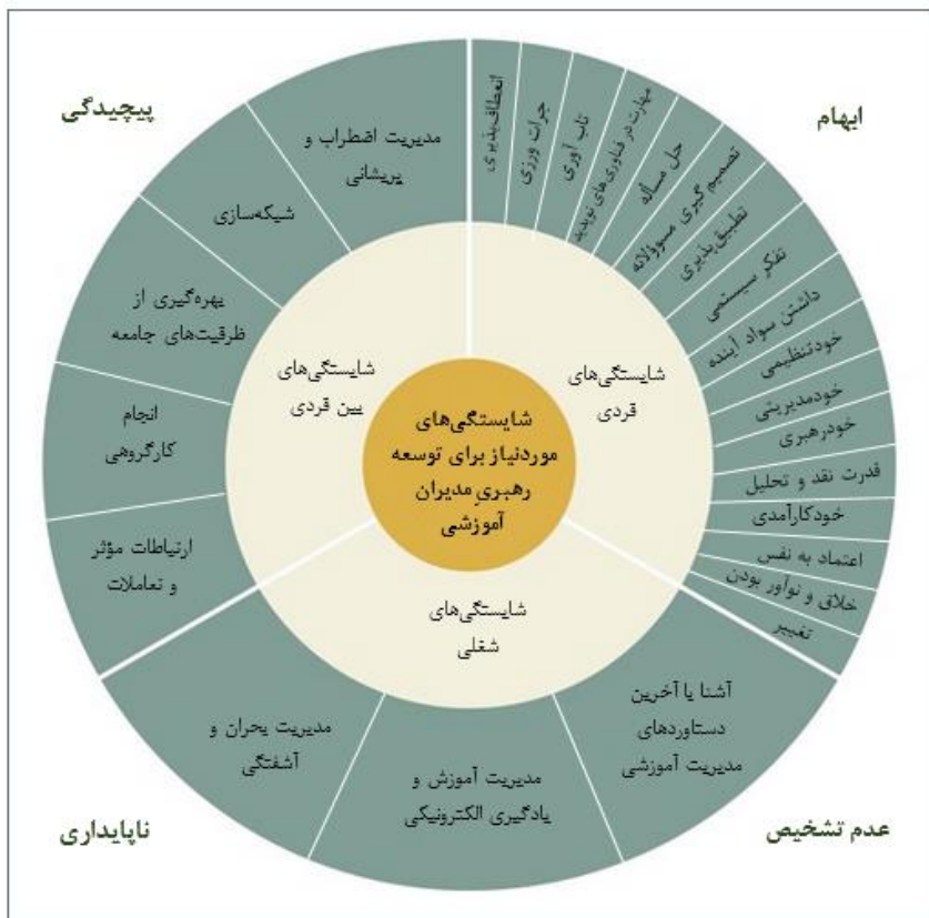
شکل ۲. چارچوب شایستگی‌های موردنیاز برای توسعه رهبری مدیران آموزشی در شرایط واکا

«آمادگی نیروی انسانی»، «کیفیت آموزش» و «زیرساخت‌های آموزش و یادگیری الکترونیکی» شناسایی شد. نتایج این پژوهش نشان داد که مدیران آموزشی آمادگی کافی برای مدیریت آموزش در شرایط واکا را نداشته‌اند. براساس این یافته، شایستگی‌های مورد انتظار از دانش‌آموختگان مدیریت آموزشی برای رهبری در دنیای واکا مدنظر قرار گرفت. تأکید شد که برای موفقیت دانشجویان مدیریت آموزشی در دنیای واکا، بازنگری در برنامه‌های آماده‌سازی دانشجویان مدیریت آموزشی اهمیت دارد. در پاسخ به این نیاز شناسایی شده، پژوهش حاضر، با هدف شناسایی شایستگی‌های موردنیاز برای توسعه رهبرانی که بتوانند در دنیای واکا، به خوبی از عهده رهبری سازمان‌های آموزشی برآیند، طراحی و اجرا شد. مجموعه این شایستگی‌ها برای توسعه رهبری مدیران آموزشی در دنیای واکا در قالب چارچوب زیر سازماندهی و جمع‌بندی شده است. مسیر تشخیص شایستگی‌ها از درون به بیرون است اما چارچوب کلی شایستگی‌ها در میدانی از مختصات محیطی شامل ویژگی‌های محیط واکا معنی و مصداق پیدا می‌کند.