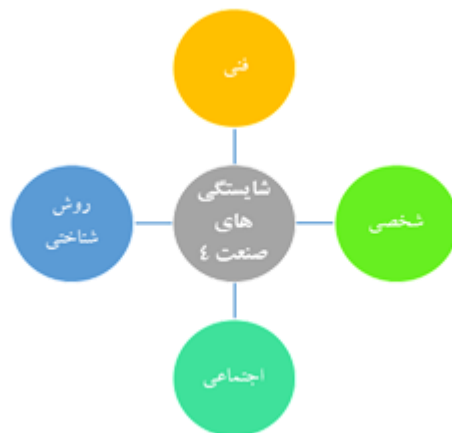
شکل ۱- چارچوب مفهومی الزامات شایستگی حرفه‌ای در صنعت نسل چهارم (۲۳)

شایستگی‌های اصلی مورد نیاز مدیران برای مواجهه با شغل و وظایف خاص در صنعت ۴ را تهیه نمودند که به چهار دسته اصلی از شایستگی‌های حرفه‌ای تقسیم می‌شود: فنی، روش‌شناختی، اجتماعی و فردی. از دسته‌های مزبور می‌توان برای ایجاد مدل شایستگی حرفه‌ای جهت ارزیابی شایستگی‌های خاص تک‌تک کارکنان براساس انواع مختلف کسب‌وکارها، بخش یا صنعت خاص با مشخصات شغلی خاص و شناسایی شکاف شایستگی کارکنان بهره برد. اوانز ۱ (۲۰۱۵) اذعان نمود که مدیران کیفیت برای ارتقا بینس خود نسبت به عملیات‌ها و فعالیت‌های کسب‌وکارشان در جهت اتخاذ تصمیم‌های بهتر مبتنی بر واقعیات در آینده باید از مهارت‌های تحلیلی (استفاده و بکارگیری داده‌ها، فناوری اطلاعات، ابزارهای تحلیل آماری، روش‌های کمی و مدل‌های ریاضی رایانه‌محور) مرتبط با علوم هوش مصنوعی، تحقیق در عملیات و ... برخوردار باشند (۱۳). هرناندز-دی-منندز و همکاران (۲۰۲۰) در مطالعه خود بر مهارت‌های حل مسئله، شایستگی‌های بین فردی، شایستگی‌های فراشناختی ۲ ، تفکر سیستمی و سواد فناورانه برای فعالیت مدیران کیفیت در صنعت نسل ۴،۰ تأکید نمودند (۲۷). تجربه، آموزش، پتانسیل‌های خلاقیت و توانایی‌های شناختی، توسعه و هدف‌گذاری اثربخش، کارکردهای رهبری و ارتباطات، شایستگی‌هایی هستند که در مطالعه دویگل ۳ و همکاران (۲۰۲۰) مدنظر قرار گرفتند (۲۸). در این پژوهش از مدل هکلاو و همکاران (۲۳) به‌عنوان چارچوب مبنایی شناسایی شایستگی‌های حرفه‌ای مورد نیاز مدیران کیفیت برای ورود به صنعت نسل ۴ استفاده شده است.