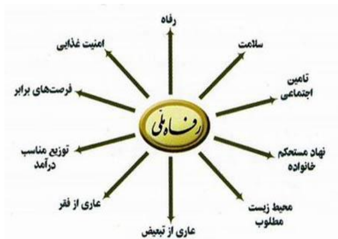
شکل شماره ۲. شاخص رفاه ملی در سند چشم‌انداز ۲۰ ساله ایران

برخورداری افراد جامعه ایرانی از رفاه ملی است که یکی از زیر شاخه‌های رفاه ملی برخوردارگی از فرصت‌های برابر است.