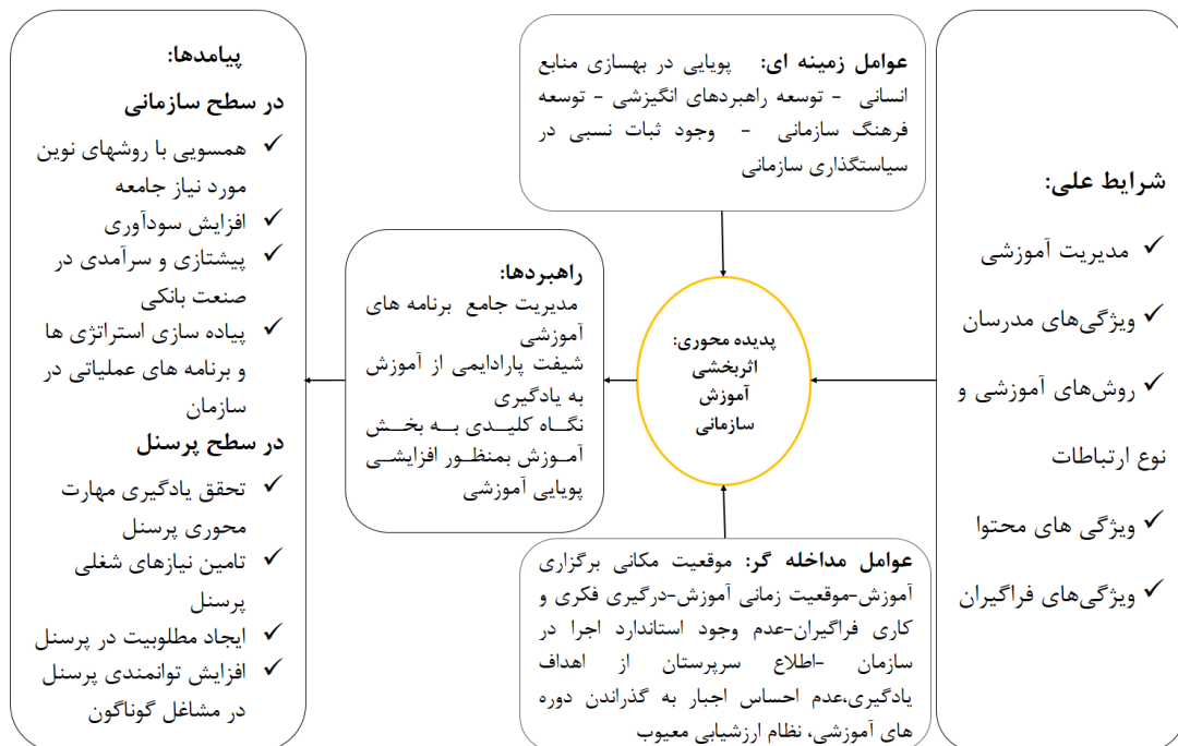
شکل شماره (۲): مدل ارتباطی اثربخش در آموزش سازمانی ضمن خدمت