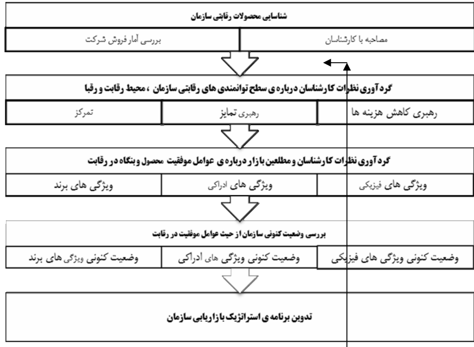
شکل ( ۳ ) مراحل موقعیت یابی استراتژیک بنگاه

با توجه به نتایج تحقیق و تجربیات کسب شده ، مدلی به قرار زیر جهت موقعیت یابی استراتژیک بنگاه ها ارایه می گردد.