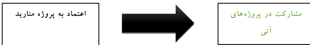
شکل شماره (۱): مدل مفهومی پژوهش