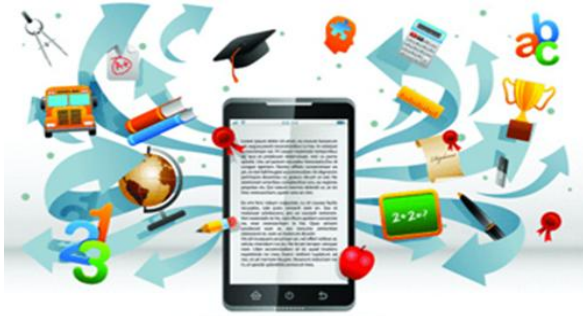
شکل ۷- یادگیری سیار

شده است. حال پس از چند سال که از تولید فناوری تلفن همراه و برطرف شدن نیازهای ارتباطی و سرگرمی می‌گذرد، دغدغه اصلی متولیان فناوری تلفن همراه، برآورد نیازها و خواسته‌های آموزشی و یادگیری متقاضیان می‌باشد. زیرا فناوری موبایل موجب افزایش تعاملات بین عناصر نظام آموزشی، افزایش رغبت فراگیران به یادگیری، کاهش نارسایی‌های آموزشی، کاهش هزینه‌های یادگیری، و ... می‌شود. نتایج پژوهشی نشان داد که متغیرهای سودمندی درک شده، سهولت درک شده و کاربرد سیستم بر نگرش دانشجویان نسبت به یادگیری به سیار اثرگذار هستند [۲۷]. شواهد یک پژوهش نشان داد که میزان یادگیری و یادداری در میان افراد آموزش دیده با روش یادگیری سیار، بیشتر از روش سنتی است [۲۸].