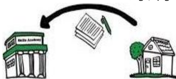
شکل ۴- یادگیری مکاتبه‌ای

نسل اول آموزش از راه دور، آموزش مکاتبه‌ای نام دارد. در این نسل از سیستم پستی برای انتقال محتوای آموزش استفاده شد. این نسل به آموزش تک رسانه‌ای نیز مشهور است؛ چرا که فناوری مورد استفاده در آن، فقط چاپ کتاب‌های استاندارد و جزوات یکنواخت بود [۱۷]. روش آموزش در نظام‌های نسل اول بر نظرات رفتارگرایی یعنی پاسخگویی، قابل مشاهده‌بودن و تقسیم مفاهیم پیچیده به اجزای خرد و قابل درک و فهم می‌باشد. آنچه را که فراگیران یاد می‌گیرند، کاملاً تعریف شده و مبتنی بر نظرات اثبات‌گرایانه است که براساس آن واقعیت شخصی وجود دارد که با توجه به آن می‌توان هدف‌های یادگیری را تنظیم کرد. از این دیدگاه تأکید عمده بر آزمون و ارزشیابی یادگیری براساس اهداف از پیش تعیین شده است که در آن دانش کسب شده آشکار می‌باشد و توسط یادگیرندگان قابل ارائه و نمایش است [۱۸]. ویژگی‌های نسل یادگیری مکاتبه‌ای عبارتند از: شکل‌گیری فناوری‌های نوشتاری و خودآموزها، استفاده از پست برای برقراری ارتباط دو طرفه، البته باید متذکر شد که این نوع ارتباط بصورت غیرهمزمان بوده و دارای تأخیر زمانی زیادی نیز بوده است. گستره یادگیرندگان در این نسل خیلی زیاد نبوده، همچنین فاصله آن‌ها نسبت به یکدیگر و معلم تقریباً کم است (از لحاظ پراکنندگی جغرافیایی). بصورت کلی، این سیستم آموزشی، سنت‌شکنی کرده و امکان آموزش انعطاف‌پذیر را برای یادگیرندگان و علاقمندان به مطالعه و یادگیری فارغ از عوامل زمانی و مکانی فراهم می‌نماید.