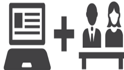
شکل ۸- یادگیری تلفیقی

را برای نظام آموزش حضوری به صورت از راه دور فراهم ساخته است و نظام آموزش حضوری از ظرفیت بالایی برای بهره‌گیری از شیوه‌های آموزش از راه دور برخوردار شده است. فراگیران در یادگیری تلفیقی از یک عامل بسیار مهم بهره‌مند می‌شوند که در یادگیری سیار و الکترونیکی به نسبت کمتر از یادگیری تلفیقی است و آن نیز «حس حضور» می‌باشد. در واقع حس حضور یکی از عوامل بسیار مهم در هر فضای آموزشی است. فراگیران وقتی احساس کنند که تعامل احساسی با معلم و یا دیگر فراگیران دارند، به میزان بیشتری یاد می‌گیرند و در یادگیری تلفیقی این امکان فراهم شده است تا ضمن یادگیری به صورت الکترونیکی و سیار، فراگیران از حس حضور نیز برخوردار باشند. در پژوهشی که به مقایسه اثر یادگیری الکترونیکی، حضوری، و تلفیقی پرداخته شد، نتایج نشان داد که یادگیری تلفیقی از نظر تأثیر در یادگیری و کاهش افت تحصیلی نسبت به دور رویکرد دیگر، مؤثرتر است [۶۴]. همچنین نتایج پژوهشی دیگر نشان داد که یادگیری تلفیقی به عنوان رویکردی جدید در نظام آموزشی است. در این رویکرد جدید، معلم و فراگیران با بهره‌گیری از فناوری‌های جدید اطلاعاتی و ارتباطی قادرند تا محیط‌های یادگیری جدید و متنوعی را علاوه بر کلاس‌های حضوری خلق کرده و یادگیری را تسهیل کنند [۳۰].