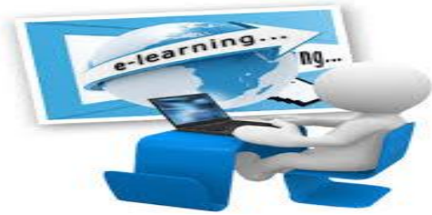
شکل ۵- یادگیری الکترونیکی

آن‌ها کمک خواهد کرد تا فنون خودتنظیمی بیشتری را در یادگیری به کار گیرند و در نهایت پیشرفت و موفقیت بیشتری را به دست آورند [۲۵].