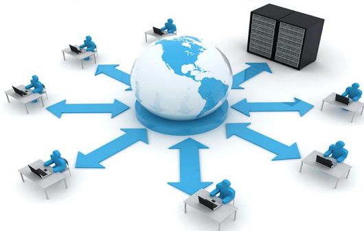
شکل ۶- یادگیری برخط (آنلاین)

یادگیری آنلاین بزرگترین انقلاب در آموزش و یادگیری معاصر بود و تغییر بزرگی در سیستم آموزشی به وجود آورد. جای تعجب نیست که چرا میلیون‌ها فراگیر در سراسر دنیا برنامه‌های آموزش آنلاین را انتخاب می‌کنند. دلیل انتخاب آموزش آنلاین نیز محدودیت‌های آموزش سنتی همچون هزینه‌های زیاد، لزوم حضور همزمان در کلاس درس، و ... و پیشرفت‌های فناوری می‌باشد [۴۸]. یادگیری آنلاین، یک روش برای یادگیری بدون نیاز به حضور در کلاس درس است [۴۹]. در واقع در یک دوره آموزشی آنلاین، بدون ملاقات یاددهنده، در کلاس درس به یادگیری می‌پردازید. یعنی در هر زمان و هر مکانی که دوست داشته باشید. چنین انقلابی در یادگیری را بی‌شک باید مدیون رشد فناوری‌های اطلاعاتی و ارتباطی دانست. فراگیران در یادگیری آنلاین می‌توانند به راحتی در سمینارها، وبینارها، کلاس‌های آنلاین و ... در هر جای دنیا شرکت کنند و به یادگیری بپردازند و محدودیتی در ارتباط‌های از راه دور نداشته باشند.