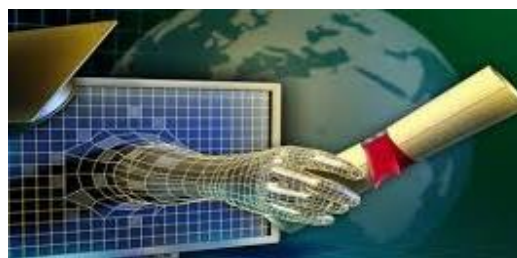
شکل ۳- یادگیری از راه دور