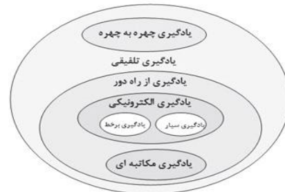
شکل ۱- انواع یادگیری و جایگاه آن‌ها [۳۶]

آموزش و یادگیری از راه دور شامل دو نسل یادگیری مکاتبه‌ای و یادگیری الکترونیکی می‌باشد که در ذیل به آن‌ها اشاره می‌شود.