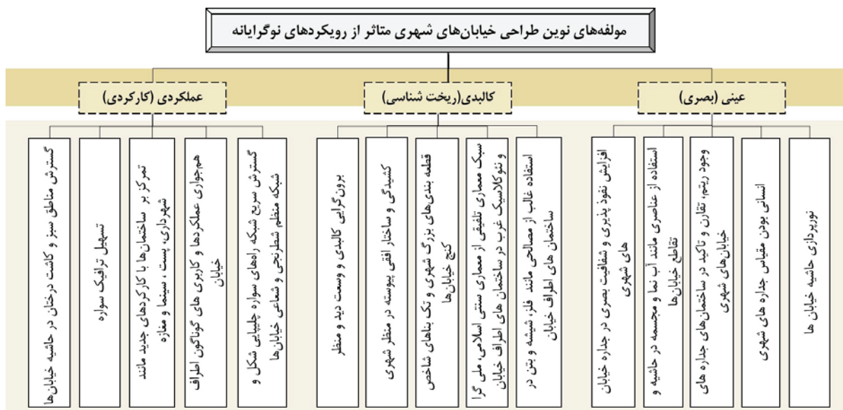
مولفه‌های نوین طراحی خیابان‌های شهری متأثر از رویکردهای نوگرایانه

نمودار شماره ۳: نمودار مولفه‌های نوین طراحی خیابان‌های شهری متأثر از رویکردهای نوگرایانه در سطوح مختلف؛ ماخذ: نگارندگان