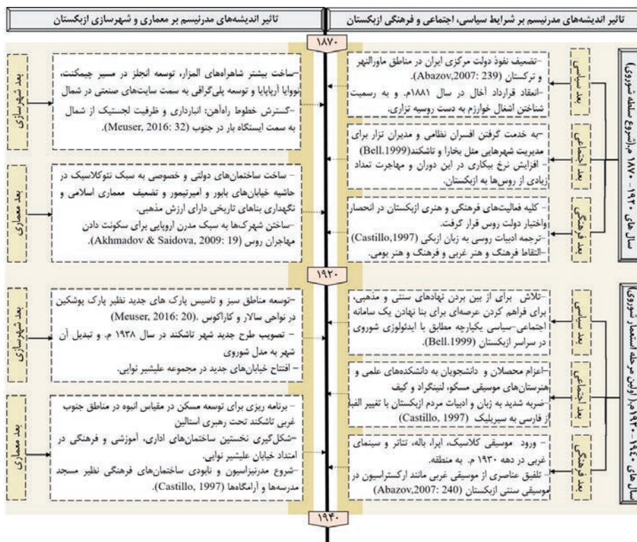
نمودار شماره ۲: فرآیند تاثیر اندیشه‌های مدرنیسم بر شرایط اجتماعی و فرهنگی و عرصه‌های معماری و شهرسازی ازبکستان در فاصله سال‌های ۱۸۷۰-۱۹۴۰ م.؛ ماخذ: نگارندگان

آسیای مرکزی همواره یکی از مراکز مهم فرهنگ و تمدن بشری به‌شمار می‌آمده است و ویژگی بارز آن به هم تنیدگی اقوام، مذاهب و ملیت‌های گوناگون بوده است. در این مناطق شهرنشینی و تمدن در کنار چادرنشینی و صحراگردی وجود داشته و بر یکدیگر اثر گذارده‌اند. سلطه روس‌ها بر منطقه آسیای مرکزی زمانی به وقوع پیوست که این منطقه دوران افول فرهنگی را می‌گذراند. این سلطه، به ویژه در دوران هفتادساله اتحاد جماهیر شوروی سوسیالیستی، تاثیر قابل توجهی بر فرهنگ و هنر این منطقه گذارد. کلیه امور فرهنگی و هنری مرتبط با دین، از خوشنویسی گرفته تا معماری مساجد و مدارس، در این دوره آسیب‌های فراوانی دیدند و برخی ژانرهای هنری آن‌ها به کلی از بین رفتند. همچنین تغییر خط رسمی از فارسی