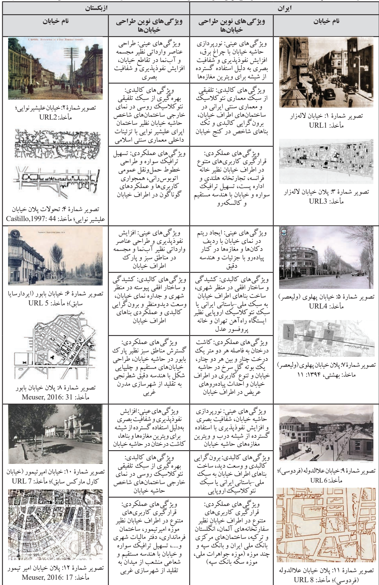
جدول شماره ۲: نمونه خیابان‌های منتخب با طراحی نوین شهری در تهران و تاشکند در فاصله سال‌های (۱۳۲۰-۱۳۵۰ ه.ش. و ۱۹۴۰-۱۸۷۰ م.)