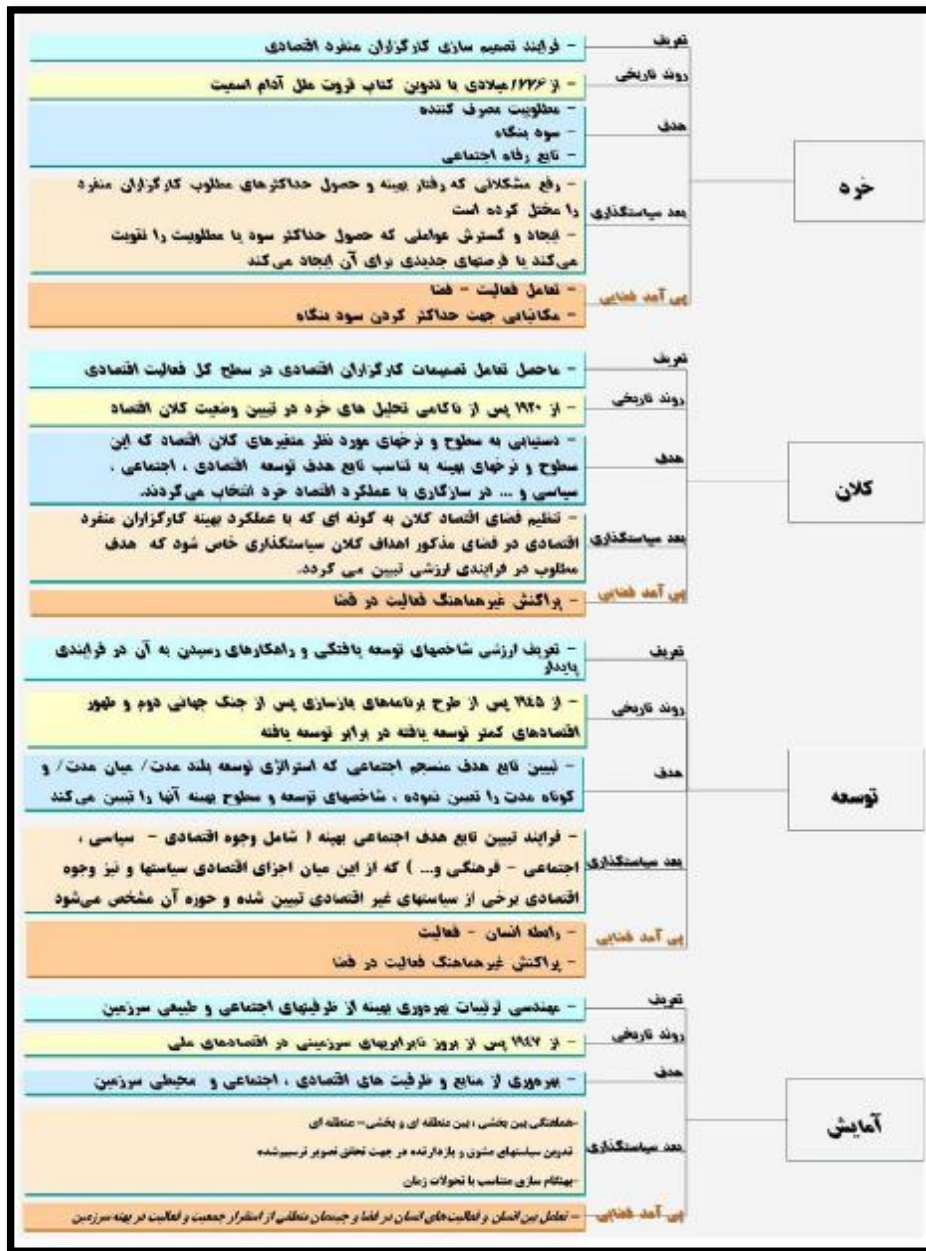
شکل 4: رویکردهای متفاوت در برنامه ریزی و توسعه، (مأخذ: دفتر آمایش و توسعه پایدار سازمان مدیریت و برنامه ریزی کشور، 1383، 9)