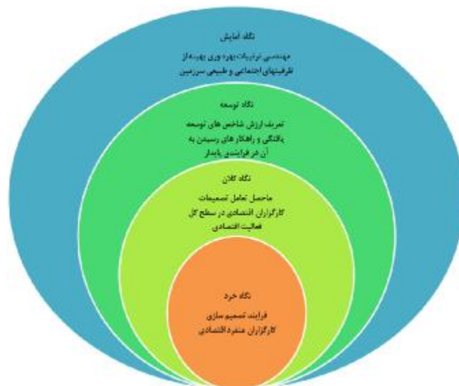
شکل 5: مفاهیم کلی در رویکردهای متفاوت برنامه ریزی و توسعه (دفتر آمایش و توسعه پایدار سازمان مدیریت و برنامه ریزی کشور، 1383: 10)

دو نتیجه مهم که در اینجا قابل ذکر است عبارت است از: