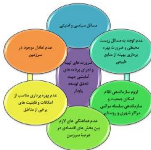
شکل 6: آمایش و توسعه پایدار (دفتر آمایش و توسعه پایدار سازمان مدیریت و برنامه ریزی کشور، 1383:13)