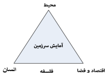
شکل 2: ابعاد آمایش سرزمین

قرار گرفته است که بعضاً ناقص و همچون شرکت ستیران در ایران نسبت به آمایش سرزمین اقدامی مقدماتی داشته است. از سویی یکی از وظایف اصلی جغرافیا، ساماندهی فضا و آمایش سرزمین و کمک به توسعه است.