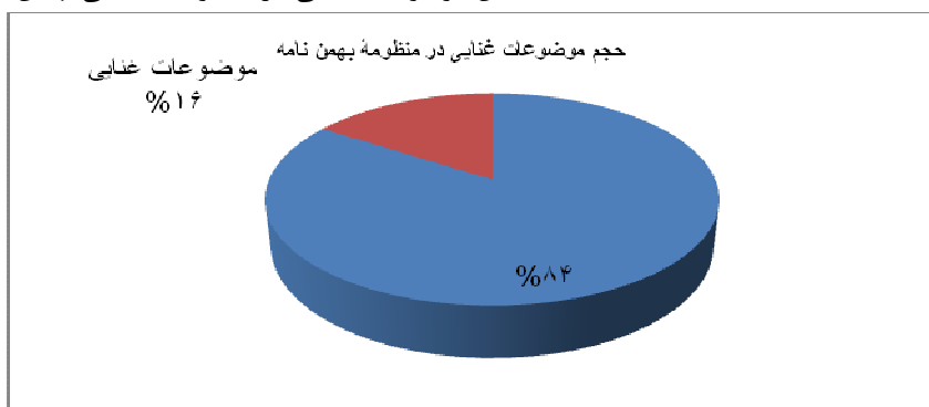
۱. بسامد موضوعات غنایی در تناسب با متن است.