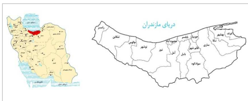
نقشه ۱. موقعیت استان مازندران در کشور

استان مازندران از استان‌های شمالی کشور ایران، با مساحتی حدود ۲۳۸ هزار کیلومتر مربع، ۱.۴۶ درصد مساحت کشور را به‌خود اختصاص داده و از لحاظ مساحت خاکی، هجدهمین استان کشور می‌باشد. جمعیت این استان حدود ۳ میلیون نفر است که معادل ۴.۳۱ درصد از جمعیت کل کشور است. فعالیت اصلی استان مازندران کشاورزی می‌باشد (برنامه آمایش استان مازندران، ۱۳۸۸، ج ۱، ۷). این استان براساس اطلاعات برنامه آمایش، دارای ۱۶ شهرستان است. موقعیت این استان در نقشه شماره ۱ نشان داده شده است.