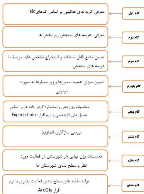
نمودار ۱. مدل مفهومی سنجش فعالیت‌پذیری زیربخش زراعت شهرستان‌های استان مازندران، مأخذ: یافته‌های پژوهش

تعیین فعالیت‌های مناسب و توان پذیرش هر منطقه از فعالیتی مشخص، نیازمند شناسایی زمینه‌ها و شاخص‌های معینی است. بدین‌منظور جهت سنجش فعالیت‌پذیری شهرستان‌های استان مازندران، به‌تفکیک گروه اقتصادی هدف (کشاورزی) در بستر مدل مفهومی ذیل (نمودار ۱) قابل ارائه است: