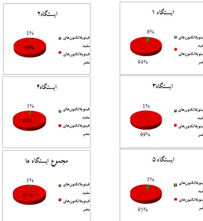
شکل ۲: نسبت تراکم گروه‌های فیتوپلانکتونی مفید به مضر در ایستگاه‌های مورد بررسی و نیز در مجموع اکوسیستم

همانطور که در جدول فوق قابل مشاهده است، معناداری مقادیر شاخه داینوفلاژله‌ها و باسیلاریوفیتا در ایستگاه‌های مختلف روند یکسانی را طی می‌کند. بر این اساس در ایستگاه‌های ۲ و ۳ عدم اختلاف معنادار ( p < 0.05 ) و در سایر ایستگاه‌ها اختلاف معنادار ( p > 0.05 ) در مورد هر دو گروه مشاهده می‌شود. شاخه اولگنلفایتا نیز در ایستگاه‌های ۳ و ۵ دارای اختلاف معنادار ( p > 0.05 ) و مقادیر بیشتری نسبت به سایر ایستگاه‌ها می‌باشد. همان‌طور که نتایج نشان می‌دهند، تراکم کلی فیتوپلانکتون‌ها در تمامی ایستگاه‌ها نسبت به هم دارای اختلاف معنادار می‌باشد ( p > 0.05 ).