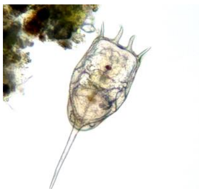
شکل ۳: زئوپلانکتون جنس Keratellacochlearis از دسته Rotifera (عکس‌برداری با استفاده از نمایشگر میکروسکوپ معکوس مدل Nikon (T1-SM))

در بررسی‌های انجام شده، تنها یک نمونه (۱ عدد) زئوپلانکتون جنس Keratellacochlearis از دسته Rotifera در ایستگاه ۴ مشاهده گردید که در شکل ۳ نشان داده شده است.