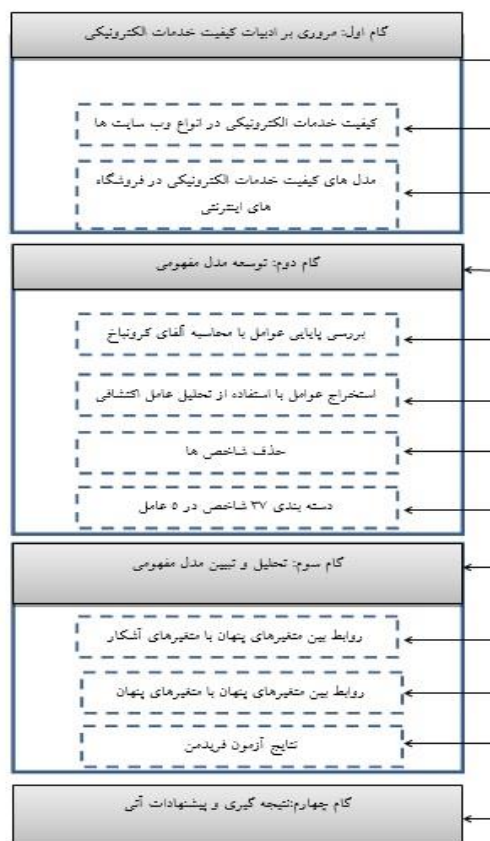
شکل ۱: فرایندهای به کار گرفته شده جهت توسعه مدل مفهومی