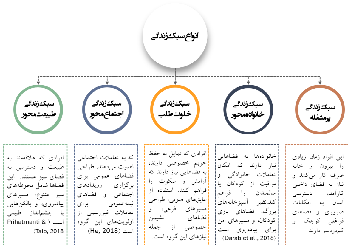
شکل ۲- دسته بندی سبک زندگی افراد

تنوع سبک های زندگی نشان دهنده ضرورت طراحی محیط های مسکونی انعطاف پذیر است. طراحی انعطاف پذیر به معنای ایجاد فضاهایی است که بتوانند به نیازهای متغیر و متنوع افراد پاسخ دهند. این طراحی شامل قابلیت تغییر در اندازه و عملکرد فضاها، استفاده از مواد قابل تنظیم و پیش بینی نیازهای آینده است (Zarrabi et al., 2021a).