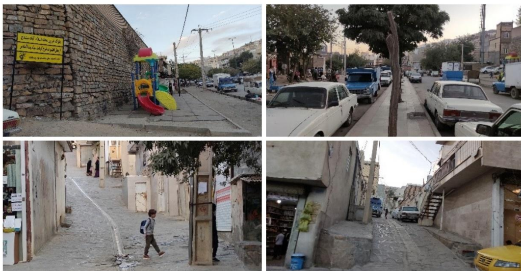
شکل ۲. محله تفتقان (اسلام‌آباد)

در ادامه به محله نایسر می‌پردازیم، موقعیت آن در شمال شرق شهر سنندج و از شهر فاصله گرفته و دارای جمعیت نسبتاً بیشتری به دو محله دیگر است. در ابتدای ورود به خیابان‌های نایسر جمع‌آوری زباله‌ها صورت می‌گیرد که چهره آن را نامناسب کرده است، فضاهای بازی برای کودکان تنها به یک پارک کوچک محدود شده است که برای جمعیت محله نایسر قطعاً پاسخگو نیست؛ پارک در یک محیط باز و پشت خیابان قرار گرفته که فضای آزاد و بدون خطری را برای کودکان مهیا ساخته است اما ساخت‌وسازهای اطراف، کوچک بودن فضا و دسترسی نامناسب پیاده‌روها را شاهد هستیم که از ضایعات صنعتی پر شده‌اند و یا حاکی مانده‌اند و دسترسی نایمنی را ایجاد کرده‌اند. این فضا قابلیت تبدیل به فضایی بزرگ‌تر با ایجاد فضاهایی سبز و مناسب گردهمایی‌ها است. وجود کوچه‌های خاکی زیاد،