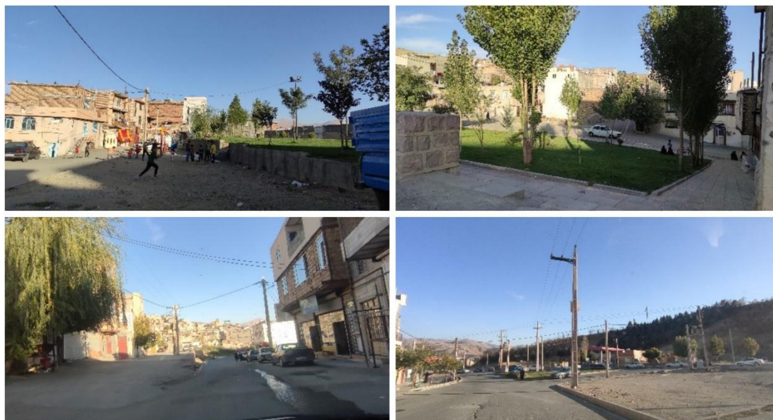
شکل ۴. محله فرجه