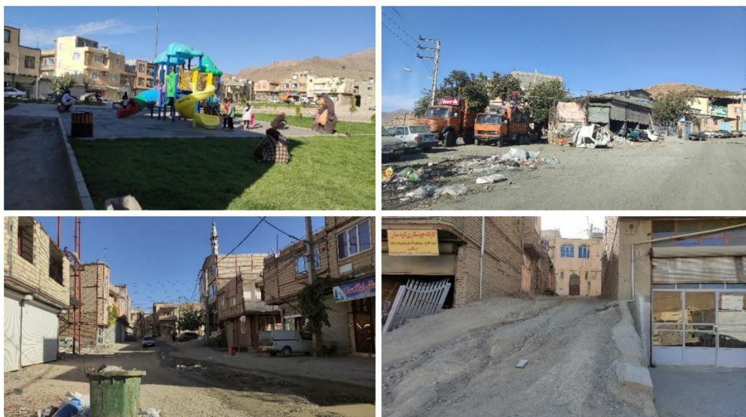
شکل ۳. محله نایسر، منبع: نگارندگان

پیاده و معابر نامناسب و شیب‌دار که تردد را برای کودکان دشوار کرده است، از جمله دیگر عواملی است که باعث کمبود فضاهای کودک محور در این محله شده است. عبور و مرور و ترافیک سنگین در صبح، ظهر و مخصوصاً مغرب، مخاطراتی را برای عبور و مرور ایجاد می‌کند. مدرسه اصلی نایسر بر روی تپه‌ای قرار دارد و تقریباً در حاشیه نایسر قرار گرفته که محورهای دسترسی به آن خاکی است و دارای شیب تند و سخت مخصوصاً برای زمستان است. متأسفانه مشاغل کاذب زیادی مانند فروش مواد مخدر و مشروبات الکلی در نایسر به وجود آمده که امنیت آن را کاهش داده است و ساکنین نیز از این مشاغل و عبور و مرور افراد نامناسب در محله، ناراضی و نگران هستند.