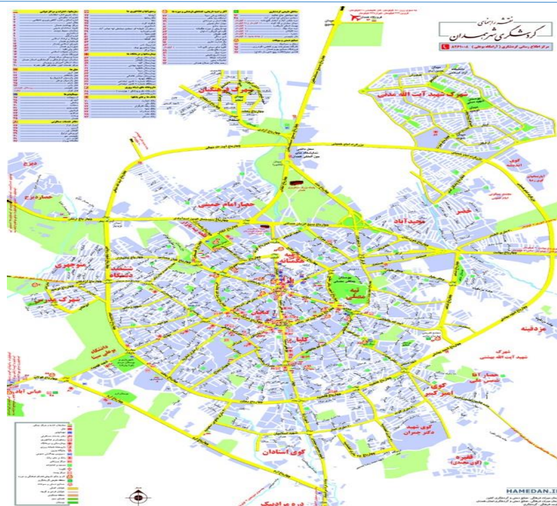
شکل ۲. نقشه گردشگری شهر همدان (اداره کل میراث فرهنگی، صنایع دستی و گردشگری استان همدان، ۱۳۹۷)