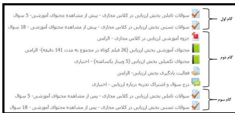
شکل ۳. نمونه‌ای از بخش‌های دوره و گام‌های آن: گام‌های بخش ارزیابی در کلاس مجازی

نمونه ای از طراحی انجام شده در سه بخش اصلی دوره در سامانه مدیریت یادگیری مودل در شکل ۳ مشاهده می شود: