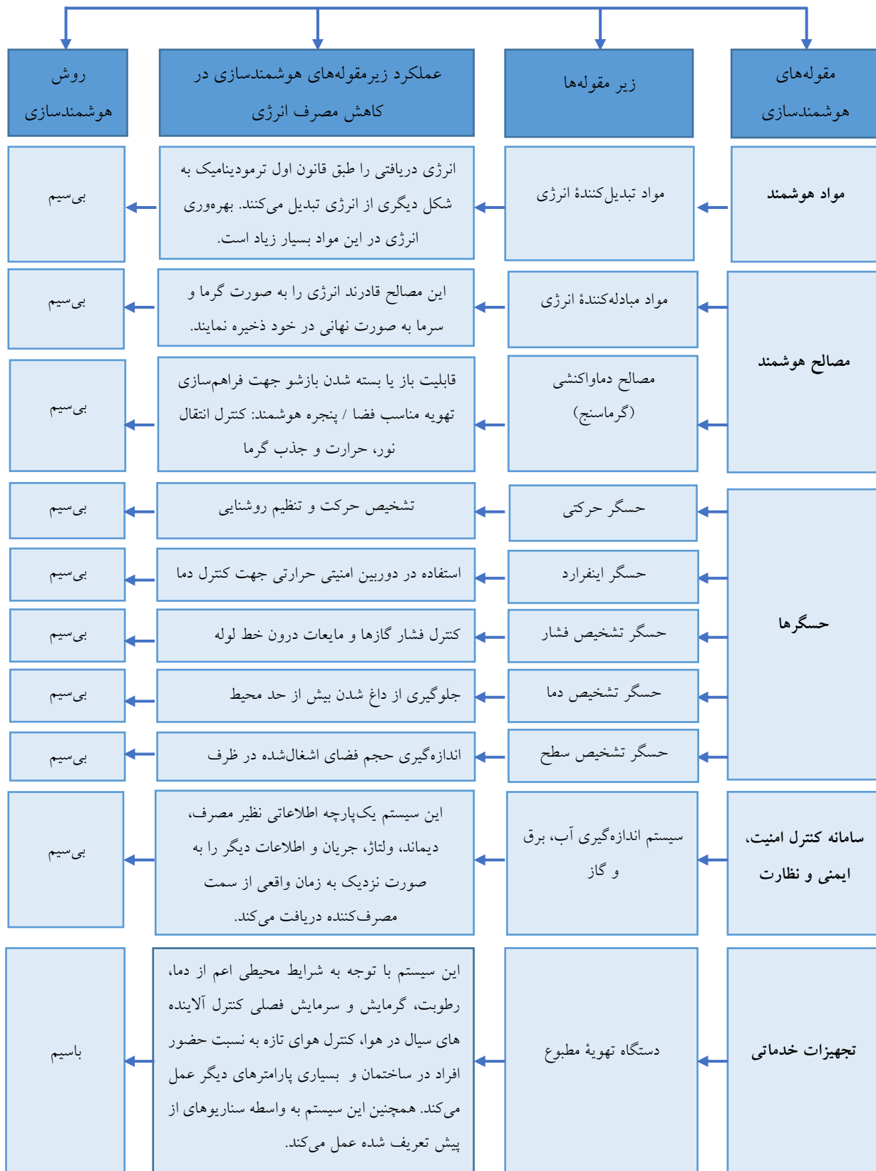
نمودار ۴ عملکرد عناصر هوشمندسازی در کاهش مصرف انرژی