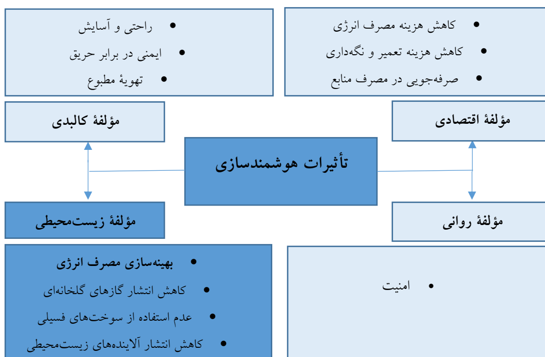
نمودار ۳ مدل مفهومی مؤلفه‌های هوشمندسازی در ساختمان، (منبع: نگارندگان)

مرور پیشینه و مبانی نظری مربوط به موضوع نشان داد که عناصر هوشمندسازی شامل تکنولوژی‌های نوین از طریق «مواد و مصالح هوشمند»، «حسگرها»، «سامانه کنترل امنیت و نظارت و ایمنی» و «تجهیزات خدماتی» می‌باشد که با دو روش باسیم و بی‌سیم می‌تواند نیاز ساکنین خانه‌های معاصر را پاسخ دهد. علاوه بر این، یافته‌ها نشان می‌دهد هوشمندسازی خانه از طریق چهار مؤلفه کالبدی، زیست محیطی، اقتصادی و روانی می‌تواند موجب ارتقای سطح کیفیت زندگی ساکنین شود که شاخص‌های مربوط به هر کدام از این مؤلفه‌ها از دیدگاه محققین مختلف مورد بررسی قرار گرفته و در قالب جدول ارائه شده است (جدول ۲) همچنین یافته‌ها نشان می‌دهد، مهم‌ترین شاخص از مؤلفه زیست محیطی، کاهش مصرف انرژی است که در این پژوهش نیز به‌طور خاص بررسی تأثیر عناصر هوشمندسازی بر صرفه‌جویی در مصرف انرژی مدنظر می‌باشد. از جمع‌بندی مؤلفه‌ها و شاخص‌های مستخرج از جدول پیشینه، مدل مفهومی زیر ارائه شده است. (نمودار ۳)