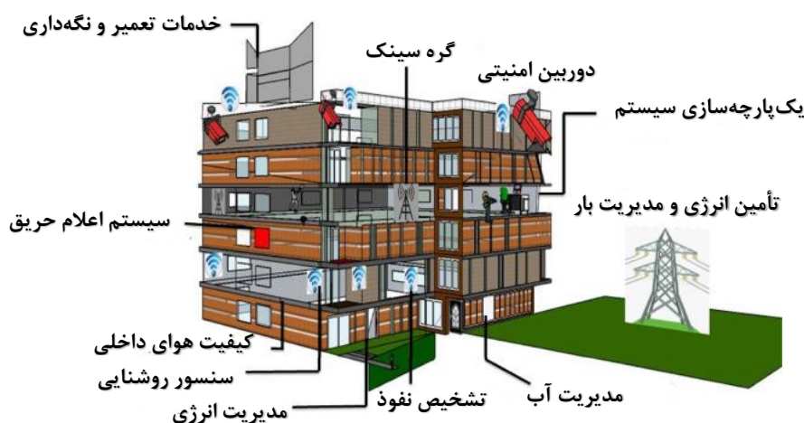
تصویر ۱: تجهیزات خانه هوشمند (Younus, ul Islam, Khan & Khan, 2019)

همان‌طور که مشاهده می‌شود، در تصویر ۱ برخی از عناصر هوشمندسازی از جمله «تجهیزات خدماتی» جهت یک‌پارچه‌سازی سیستم، سنسور روشنایی و کیفیت هوای داخلی، از «سامانه کنترل ایمنی و امنیت» جهت سیستم اعلام حریق، دوربین امنیتی، خدمات تعمیر و نگهداری و تشخیص نفوذ و از «مواد و مصالح هوشمند» جهت تأمین انرژی و مدیریت بار و مدیریت انرژی استفاده شده است.