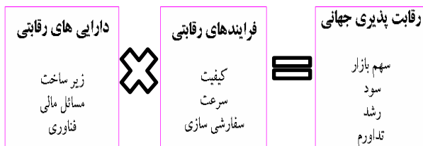
شکل ۱: فرمول رقابت پذیری جهانی (من، لائو و چان ۲۰۰۲)

۵. عدم حفظ سهم تولید در حوزه‌های قدیمی به دلیل زیرساخت‌های کهنه (پایین بودن ضریب ازدیاد برداشت): ایران برای حفظ سهمیه تولید حدود ۴۲/۱۳ درصدی خود در اوپک، باید ظرفیت‌های تولید خود را تا سال ۲۰۱۵ و ۲۰۲۰ به ترتیب به حدود ۵ و ۶ میلیون بشکه در روز افزایش دهد (گزارش مرکز پژوهش‌های مجلس، ۱۳۹۱). به دلیل فرسودگی، در اغلب مخازن نفت در حال تولید در ایران، ضریب بازیافت مخازن به شدت کاهش یافته و تزریق گاز به این میادین هم با جدیت پیگیری نمی‌شود. به همین دلیل، میزان تولید نفت از میادین موجود نیز مدام در حال کاهش است و همین امر دستیابی به هدف تولید ۵ میلیون بشکه نفت خام در پایان برنامه پنجم توسعه را با مشکل مواجه می‌سازد. این در حالی است که کشورهای همسایه به ویژه عراق، در میادین مشترک با بهره‌گیری از فناوری‌های شرکت‌های غربی، به سرعت در حال توسعه این میادین است. ۶. فاصله زیاد از لحاظ تکنولوژیکی و مالی با رقبای خارجی: صنعت نفت و گاز، صنعتی سرمایه‌بر و دارای فناوری به نسبت پیچیده است که احتیاج به سرمایه‌گذاری‌های گسترده مالی و بانکی و ورود فناوری‌های جدید دارد که معاملات و داد و ستدهای بانکی و مالی، به شدت تحت تأثیر تحریم‌های بین‌المللی بوده و در نتیجه به‌طور مستقیم بر صنعت نفت و گاز اثر می‌گذارند. از سوی دیگر، موانع واردات فناوری‌ها نو در این صنعت، بتدریج بخش فرسوده و قدیمی تجهیزات را بدون جایگزین نموده و آنها از دور خارج می‌نماید.