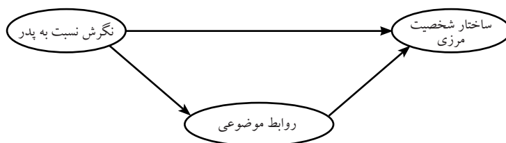
شکل ۱. مدل پیشنهادی

خیالی ارتباطات گذشته فرد همراه با دفاع‌های مربوط به هر دو، هستند. این روابط موضوعی درونی نسبتاً در طول زمان پایدار می‌مانند، اما ظرفیت اصلاح هم دارند. در این بافت، چنانچه این روابط موضوعی حالت تعارضی یا دفاعی بگیرند می‌توانند استرس زیادی را ایجاد نمایند و نشانه‌های بیماری را تولید کنند. پژوهش‌ها نشان می‌دهند که الگوی روابط موضوعی در سطوح سازماندهی شخصیت نیز ممکن است به عنوان یک عامل کلی عملکرد شخصیت عملیاتی شود (کاسپی، ۲۰۱۴؛ شارپ و همکاران، ۲۰۱۵؛ رایت و همکاران، ۲۰۱۶). در این پژوهش سعی شده که به این سوال پاسخ داده شود آیا مدل ساختاری تبیین ساختار شخصیت مرزی با نقش مستقیم نگرش نسبت به پدر و نقش واسطه‌ای روابط موضوعی از برآزش خوبی برخوردار است؟