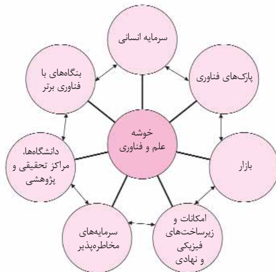
شکل ۳. ابعاد یک خوشه علم و فناوری

خوشه‌های علم و فناوری را ترکیب منسجمی از دانشگاه‌ها، پارک‌های فناوری، مراکز تحقیقی