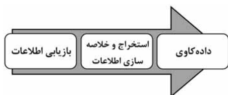
شکل ۱- مراحل متن کاوی

اطلاعات و یکپارچه سازی اطلاعات می باشد. در گام اول پژوهشگر یا دیدبان ضمن مشخص نمودن پایگاه داده های مورد نظر، اطلاعات استخراج شده از پایگاه داده ها را وارد نرم افزار واسطی که برای این امر طراحی شده است، می کند و پس از آنالیز اطلاعات مدارک فناوری، نتایج آماری اشکال مناسب و در قالب جداول و نمودارها با استفاده از روش های دیدهبانی فناوری خصوصاً متن کاوی و متن- داده کاوی ۱ عرضه خواهد شد. به طور خلاصه می توان مراحل متن کاوی را به صورت زیر شرح داد: