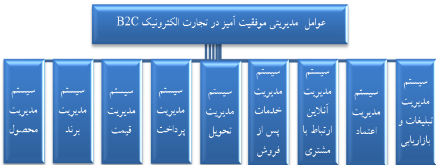
شکل ۱: مدل مفهومی پژوهش