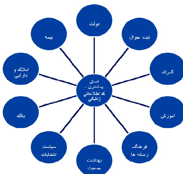
شکل ۲- دولت الکترونیک با سامانه جامع اطلاعات سایبری

در نمودار زیر، شکل پیشرفته دولت الکترونیک به همراه پیش فرض‌های آن آمده است: