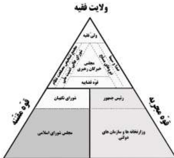
شکل ۲. توزیع قدرت در قانون اساسی ۱۳۶۸

در قانون اساسی، اصول مربوط به انتخابات و مجلس شورای اسلامی (۶۲-۹۰) در مقابل اصول مربوط به شورای نگهبان (۹۱-۹۹) و ولایت فقیه (۱۰۹-۱۱۰)، مختصات ویژه‌ای از سلسله مراتب قدرت را شکل می‌دهد که از ویژگی‌های آن جایگاه ثانوی پارلمان و انتخابات به عنوان مظهر حاکمیت ملی در مقابل جایگاه ولایت فقیه به عنوان مظهر حاکمیت الهی و خصلت ابزاری نهادهای دموکراتیک در تثبیت بنیاد اصلی نظام سیاسی است. مجلس با همه اقتدار و نفوذی که بر قوای دیگر دارد و با وجود صلاحیت در وضع قوانین و نظارت بر دستگاه‌ها و مقامات عالی‌رتبه اجرایی بدون وجود شورای نگهبان اعتبار قانونی ندارد (اصل ۹۳). همچنین نظارت استصوابی باعث می‌شود تا مجلس نتواند به عنوان محلی برای نمود اراده عمومی مطرح شود؛ زیرا تمام امور انتخاباتی زیر نظر و با صلاح دید شورای نگهبان اعتبار می‌یابد. این صلاح دید یا مصلحت‌اندیشی می‌تواند ابتکار عمل شورای نگهبان را تا آن حد بالا ببرد که آنچه را صلاح می‌داند تأیید کند و آنچه را صلاح نمی‌داند تأیید نکند؛ به عبارت بهتر در مراحل انتخاباتی دخل و تصرف نماید (هاشمی، ۱۳۸۶: ۲۵۹). در نتیجه بین مجلس شورای اسلامی به عنوان نهادی که طبق قانون اساسی، نماد حاکمیت مردم است و فقهای شورای نگهبان به عنوان پاسداران حاکمیت دینی، رابطه‌ای طولی برقرار می‌گردد (جوان آراسته، ۱۳۸۳: ۱۵۵) و مجلس به عنوان سیمایی از جمهوریت نظام باید خود را با اسلامیت آن هماهنگ نماید. در مجموع می‌توان گفت در نتیجه بازنگری قانون اساسی، جایگاه مجلس در سلسله مراتب قدرت تقلیل یافت. شکل ۲ موقعیت نهادهای قانون اساسی را در هرم قدرت نشان می‌دهد.