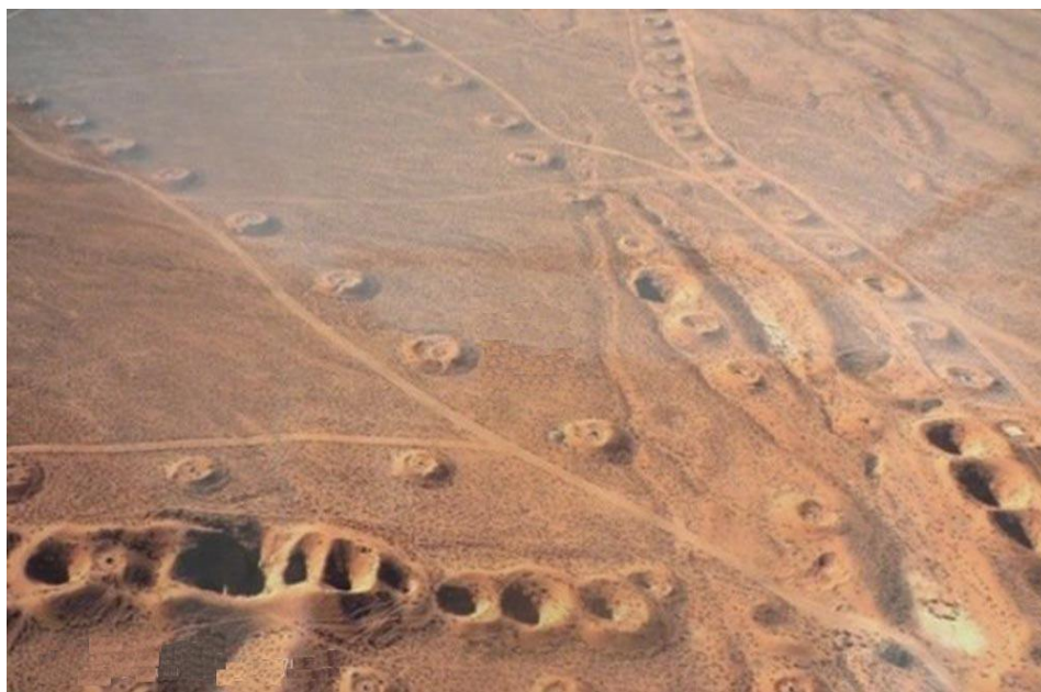
شکل ۳: عکس هوایی قنات گوهرریز جوپار

مدیریت توزیع و تقسیم آب قنات گوهرریز نیز از ویژگی منحصر به فردی برخوردار است. حدود ۱۰۰ متر پایین تر از مظهر قنات، سازه مهندسی آبی ساخته شده است که به «ششم مقسم» معروف است. در اینجا آب قنات به ۶ قسمت تقسیم می شود که آب کشاورزی شهر جوپار را تامین می کند. مقسمها، آب مظهر شده را به نسبت مالکیت در بین مالکین از طریق انتقال به جوی مربوطه تقسیم می کند. نام این مقسمها عبارتند از ۱- باج، ۲ و ۳- دیوانی، ۴- ملائی، ۵- جوپاری اربابی جهر، ۶- جوپاری اربابی برز. عرض مقسمها متغیر و بین ۳۸ تا ۸۴ سانتیمتر است که با توجه به مالکیتهای مختلف متغیر است. در زمان حاضر نیز، نسبت مالکیت آب و کارکرد مقسمها به خوبی حفظ شده و باغهای کشاورزی جوپار بر همین اساس آبیاری می شوند.