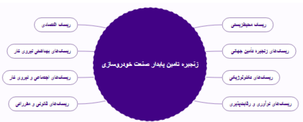
شکل: مدل ارزیابی ریسک پایداری زنجیره تامین صنایع خودرو