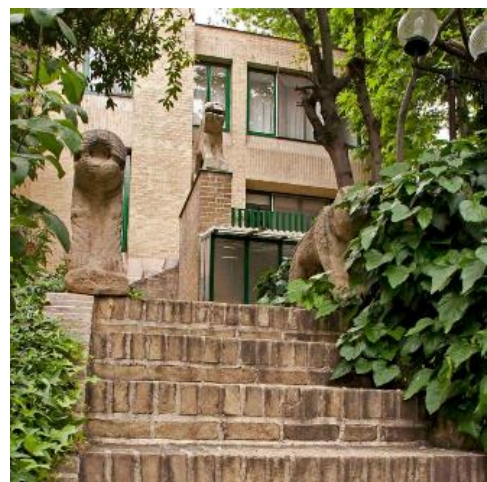
شکل ۷- خانه تناولی