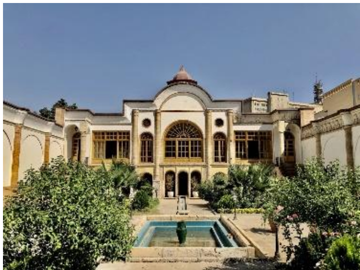
شکل ۱- خانه ناصرالدین میرزا

در خانه موتمن‌الاطبا و خانه اعلم‌السلطنه (شکل ۲)، استفاده از فضای تهی تا حد زیادی مشابه خانه ملک است، اما تفاوت‌هایی در میزان انسجام و پیوستگی بین فضاهای خالی و توده‌های ساختمانی مشاهده می‌شود. خانه موتمن‌الاطبا دارای یک حیاط داخلی با طراحی کاملاً متقارن است که تمامی فضاهای مسکونی اطراف آن به‌صورت مستقیم به این حیاط متصل هستند. این الگو تا حدی در خانه اعلم‌السلطنه نیز دیده می‌شود، اما در این بنا، حیاط کوچک‌تر بوده و فضاهای باز دیگری نیز در قالب ایوان‌ها و حیاط‌های جانبی در نظر گرفته شده است که به افزایش انعطاف‌پذیری در طراحی کمک کرده‌اند.