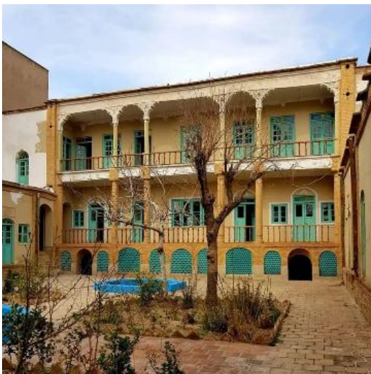
شکل ۲- خانه موتمن‌الاطبا

خانه فخرالدوله و خانه ناصرالدین میرزا (شکل ۱) نیز نمونه‌هایی از معماری سنتی هستند که در آن‌ها فضای تهی در قالب حیاط مرکزی حضور دارد، اما تفاوت‌هایی در نحوه سازمان‌دهی دارند. در خانه فخرالدوله، حیاط به‌عنوان یک عنصر کلیدی در ساختار فضاهای داخلی دیده می‌شود و نسبت فضای پر به خالی به گونه‌ای طراحی شده که حداکثر استفاده از نور طبیعی و تهویه ممکن شود. در مقابل، خانه ناصرالدین میرزا با دارا بودن ایوان‌های عمیق و گذرگاه‌های سرپوشیده، رویکردی متفاوت در طراحی فضای خالی ارائه می‌دهد. این عناصر علاوه بر ایجاد سایه، به‌عنوان فضای واسطه‌ای بین فضای بسته داخلی و محیط بیرونی عمل می‌کنند.