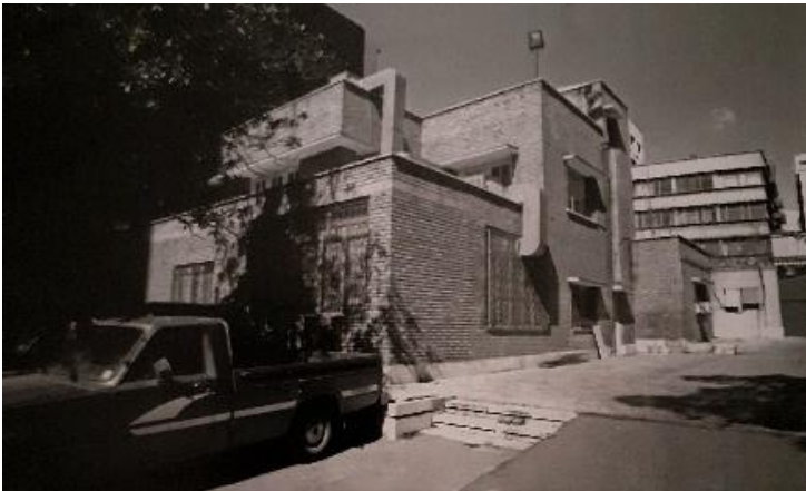
شکل ۴- خانه میردامادی

خانه ابن سینا (شکل ۳) و خانه نصیرالدوله نیز از نظر نحوه استفاده از فضای تهی، به معماری سنتی ایرانی نزدیک هستند. در این دو بنا، فضای پر و خالی به صورت متقارن و در ارتباط نزدیک با یکدیگر طراحی شده‌اند. حیاط مرکزی همچنان نقش اصلی را در سازمان‌دهی فضاها ایفا می‌کند و در کنار آن، ایوان‌های ستون‌دار و فضاهای نیمه‌باز برای تعدیل شرایط اقلیمی و افزایش آسایش ساکنان تعبیه شده‌اند. تفاوت اساسی بین این دو بنا در مقیاس فضاهای خالی است؛ خانه نصیرالدوله دارای حیاطی وسیع‌تر و ایوان‌هایی عمیق‌تر است که موجب افزایش حس وسعت در فضای داخلی می‌شود، در حالی که در خانه ابن سینا، فضاهای خالی فشرده‌تر و در مقیاس کوچک‌تری طراحی شده‌اند.