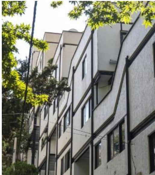
شکل ۱۱- مجتمع مسکونی آردیش

واحدهای مسکونی کمک می‌کند. در مقایسه با سایر ساختمان‌ها، این بنا کمترین میزان فضای تهی مستقل را دارد، زیرا طراحی آن بر مبنای تراکم و استفاده بهینه از زمین شکل گرفته است.