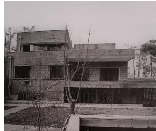
شکل ۳- خانه ابن سینا

خانه میردامادی (شکل ۴)، خانه لقمان الملک و خانه مشیرالدوله از جمله بناهایی هستند که در آن‌ها تغییراتی در نحوه استفاده از فضای تهی مشاهده می‌شود. این ساختمان‌ها با وجود حفظ برخی اصول سنتی، دارای فضاهای خالی غیرمتمرکزتر هستند. در این بناها، حیاط مرکزی به عنوان عنصر اصلی حضور دارد، اما فضاهای باز دیگری مانند گذرگاه‌ها، حیاط‌های جانبی و تراس‌های روباز نیز در نظر گرفته شده‌اند که باعث ایجاد تعامل بیشتر بین فضای پر و خالی شده است. در خانه مشیرالدوله، این رویکرد به شکل متفاوتی به کار رفته و فضاهای خالی نه تنها در قالب حیاط، بلکه در طراحی نما و تراس‌ها نیز نقش مهمی ایفا می‌کنند.