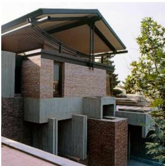
شکل ۱۰- ویلا عالیخانی

ویلای نمازی، ویلای زرتشت و خانه افشار (تصویر ۹)، سه نمونه از ساختمان‌هایی هستند که به دلیل مقیاس بزرگ‌تر و ماهیت طراحی باز خود، دارای تعامل بیشتری بین فضای پر و خالی هستند. در ویلای نمازی، فضای تهی نه تنها در قالب حیاط و تراس‌ها، بلکه به عنوان بخشی از ترکیب‌بندی اصلی نما و فرم ساختمان حضور دارد. در این ویلا، استفاده از فضاهای خالی میان دیوارها و بخش‌های مختلف، به پویایی بصری و عملکردی بنا کمک کرده است. در مقابل، ویلای زرتشت از فضای باز برای تعریف مسیرهای حرکتی و سازمان‌دهی فضایی استفاده کرده است و فضاهای خالی در آن، نقش واسطه‌ای بین فضای داخلی و محیط بیرونی دارند. خانه افشار، برخلاف این دو بنا، همچنان به اصول معماری سنتی وفادار است و فضای تهی آن بیشتر در مرکز ساختمان متمرکز شده است.