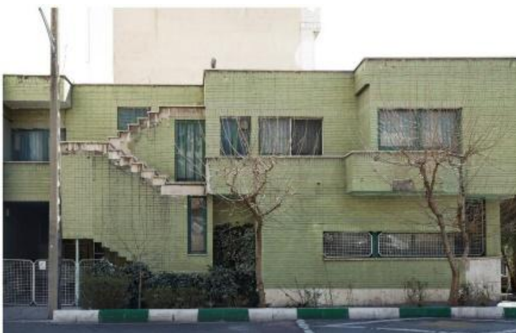
شکل ۸- ساختمان شاپان

ویلای وزرا و خانه تناولی (تصویر ۷) به عنوان نمونه‌هایی از ویلاهای ایرانی، سازمان‌دهی فضایی متفاوتی دارند. در این بناها، فضای تهی نه تنها در قالب حیاط‌های مرکزی، بلکه به صورت بازشوهای وسیع، تراس‌های نیمه‌باز و فضاهای سبز داخلی تعریف شده است. در ویلای وزرا، ترکیب فضای پر و خالی به گونه‌ای است که اجازه ورود نور طبیعی به بخش‌های داخلی را فراهم می‌کند و این فضاها به صورت سلسله‌مراتبی از ورودی تا فضاهای خصوصی داخلی سازمان‌دهی شده‌اند. خانه تناولی از لحاظ نحوه استفاده از فضای تهی، شباهت‌هایی با ویلای وزرا دارد، اما در آن، تأکید بیشتری بر فضاهای واسطه‌ای و ارتباط بصری میان داخل و خارج ساختمان دیده می‌شود.