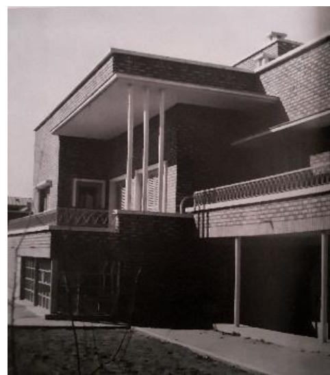
شکل ۵- خانه دکتر باهر