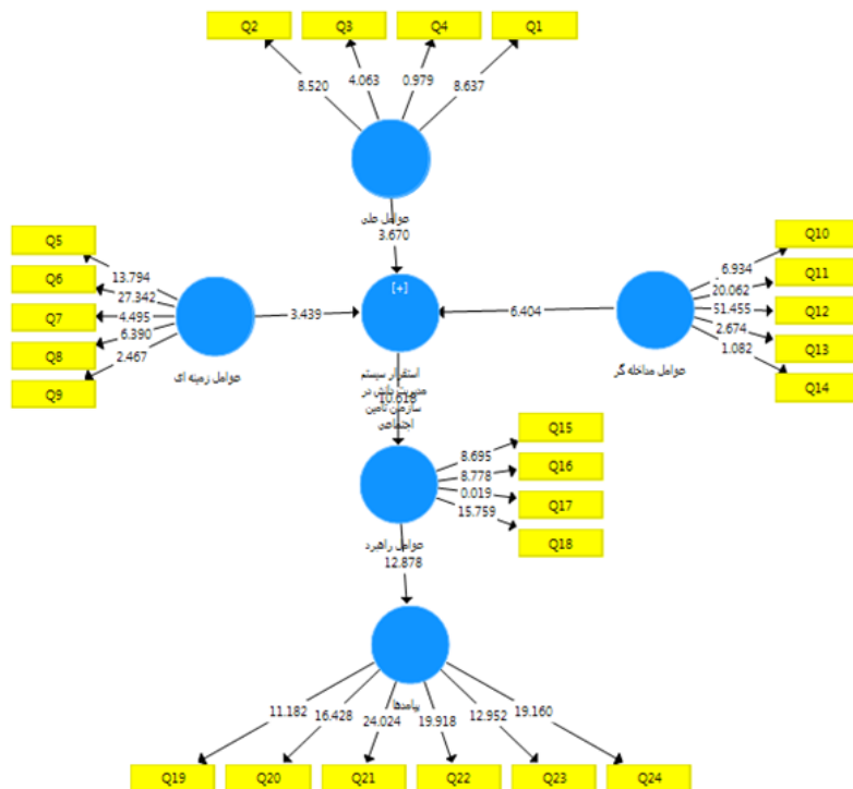
شکل ۲- بررسی فرضیه دوم و مقدار تی

همان طور که ملاحظه می شود در شکل ۱ و ۲ نشان می دهد که به دلیل p < 0.01 در ضرایب مسیر و مقدار t -value از ۱.۹۶ بیشتر است که این امر به معنادار بودن سوالات و روابط بین متغیرها در سطح ۹۵ درصد اطمینان می سازد.