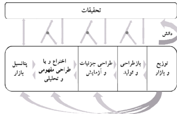
شکل ۱. مدل تعاملی فرایند نوآوری

پرسش‌های بسیاری دیگر می‌تواند، در یک گفتمان علمی متناسب، پاسخگوی ابعاد تحلیل مسئله‌ای همچون «تطبیق اصول نظام نوآوری بر وضعیت صنعت ایران در قرن نوزدهم میلادی» باشد.