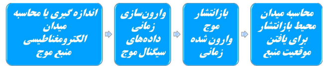
شکل ۱: روندنمای EMTR برای کمک به تعیین موقعیت منبع.

استفاده می شود [۱]. یک روندنمای برای EMTR جهت تعیین محل صاعقه در شکل ۱ نشان داده شده است. حسگر یا حسگرها در مرحله اول، شکل موج میدان الکتریکی ناشی از صاعقه را اندازه گیری می کنند که به مرحله «انتشار مستقیم»، «پیش انتشار» یا «انتشار پیشرو» نیز شناخته می شود. در مرحله دوم یا «پس انتشار»، یک نسخه معکوس شده زمانی از این شکل موجها ایجاد می گردد و پس از آن در مرحله سوم از محل نقاط حسگرها به محیط بازتابانده می شود (گامی که فاز «پس انتشار» یا «انتشار پس رو» نیز نامیده می شود). بدیهی است که درستی وارون زمانی بر اساس عدم تغییر معادلات ماکسول اعتبار دارد [۲۵].