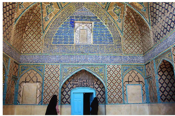
تصویر ۱۱. نمای سر در ورودی و ستون‌های مسجد