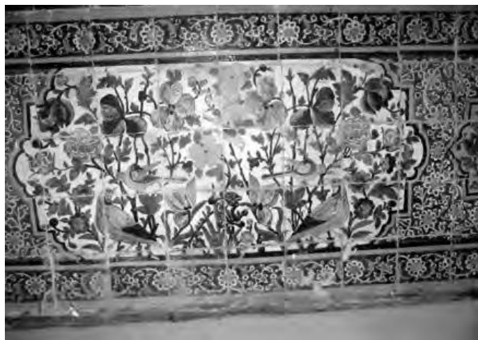
تصویر ۹. کاشی‌کاری با نقش گل و بلبل در ازاره‌ی غرفه ضلع شرقی بینه حمام خان (زارعی، ۱۳۹۱)