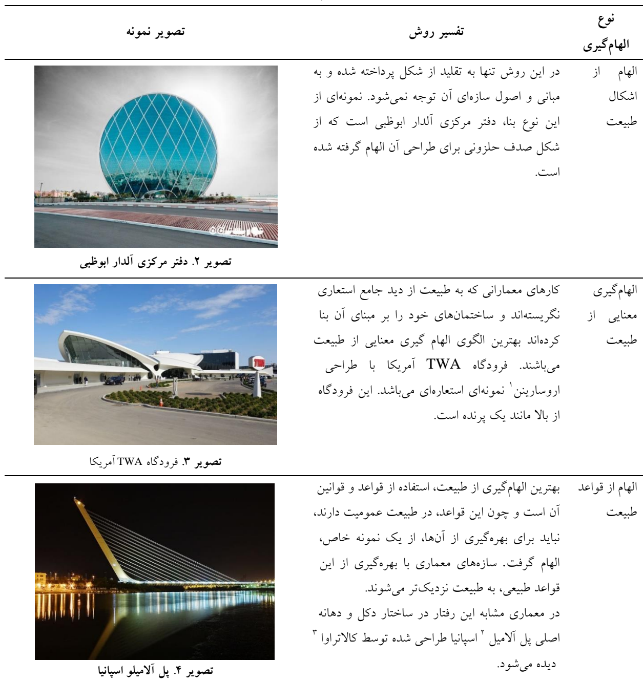
تصویر ۲. دفتر مرکزی آلدار ابوظبی