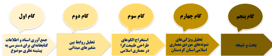
تصویر ۱. گام‌های انجام پژوهش

روش جمع‌آوری اسناد و تحلیل روابط بین متغیرهای میدانی، توصیفی-تحلیلی می‌باشد. با توجه به میدانی بودن این تحقیق، از روش جمع‌آوری اطلاعات کتابخانه‌ای برای دسترسی به پیشینه نظری موضوع و از روش جمع‌آوری اطلاعات میدانی برای جمع‌آوری اطلاعات کالبدی بهره گرفته شده است.