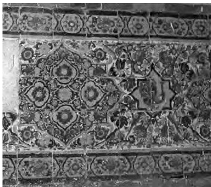
تصویر ۱۰. کاشی‌کاری سوی دیگر ازاره‌ی غرفه غربی بینه حمام خان با نقش طاووس در مرکز (زارعی، ۱۳۹۱)

درواقع مساجد را باید نخستین کانون اعتقادی، سیاسی و اجتماعی بیان کرد که پس از فتح هر منطقه بنا شده‌اند. بنیاد مساجد جدید اقتباسی بود از همان معماری شناخته شده مسجدالنبی که این تقلید به صورت یک سبک و شیوه خاص برای معماری مساجد تثبیت و به عنوان محور اصلی ساختمانی پذیرفته شد و در طول سالیان دراز تکامل یافت و عناصر جدیدی ابداع یا به آن اضافه شد؛ مانند نمونه‌هایی از مساجد جهان و ایران که بر همان سبک و شیوه بنا شد. آنچه مساجد صدر اسلام را برای پیگیری یک تفکر از دیگر کاربری‌ها ممتاز می‌دارد، در وهله نخست، نداشتن سابقه تاریخی در بستر فرهنگی معماری ایران و نیاز به دست زدن به تألیف است. از دیگر منظر به واسطه اینکه مسجد دارای پایگاه ایدئولوژیک است، به طراحی نیاز دارد. اهمیت این امر درباره فضای عبادی که تازه وارد جغرافیای ایران شده، دوچندان خواهد شد. علاوه بر همه این‌ها، مسجد یا هر فضای عبادی دیگر به نوعی بیانیه معماری دینی محسوب می‌شود. شاید برای معمار فرصت کافی برای شناخت دین نو فراهم نبوده است و در طراحی‌های خود تنها به شنیده‌ها و اخبار می‌توانست استناد کند. بعد مسافت و دوری راه از یکسو و نیاز به فضای عبادی از سوی دیگر و نبود الگوی عبادی مناسب برای مسلمانان دلایلی بودند که به احتمال زیاد با استناد به روایت رسیده از تنها الگوی مسجدالنبی، معماران ایرانی دست به طراحی ساخت مسجد بزنند (آئینی، افضلیان، اعتصام و شریعت‌راد، ۱۴۰۰).