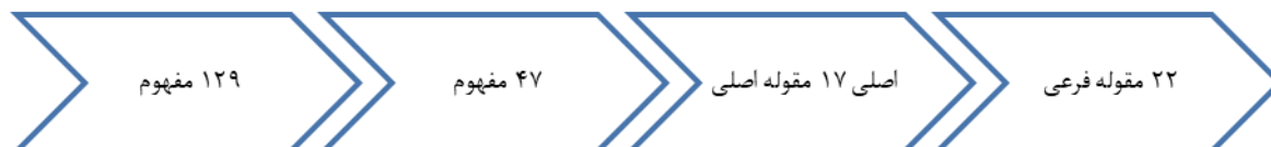
شکل (۲): روند کدگذاری و فراوانی کدها، مفاهیم و مقوله ها

روش تجزیه و تحلیل داده ها طبق نظریه داده بنیاد و بر اساس سه شیوه کدگذاری باز، کدگذاری محوری و کدگذاری انتخابی بر اساس مدل اشتراوس و کوربین انجام و تمامی مصاحبه ها کدگذاری و در مجموع ۱۲۹ کد باز، ۴۷ مفهوم و ۱۷ مقوله شناسایی و احصاء گردیده است.