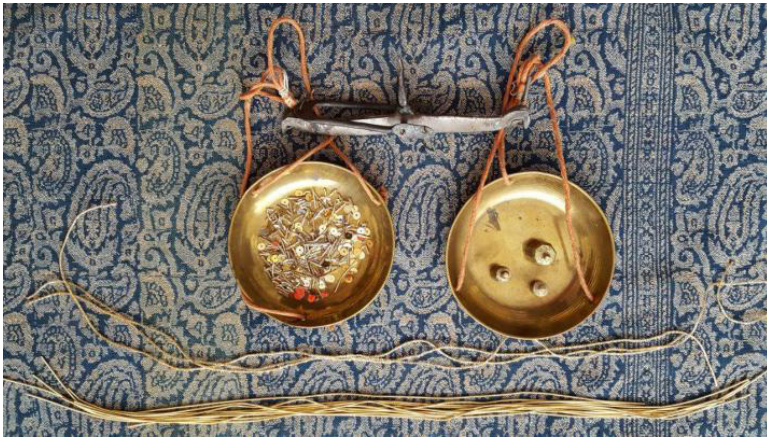
شکل ۷: نمونه ملیله دوزی روی ترمه (دوزنده: صدیقی، ۱۳۹۳)