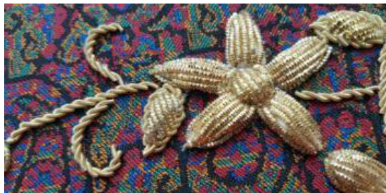
شکل ۶: برخی وسایل سنتی ملیله دوزی