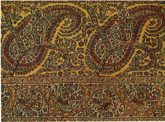
شکل ۳: نقش بته شاخ گوزنی (عناویان، ۱۳۵۴، ص ۱۱۴)

۵-۱-۹- بته بر هم سروار: در این طرح دو بته طوری برهم قرار گرفته اند که به نظر می رسد پایه هر دو یکی است.