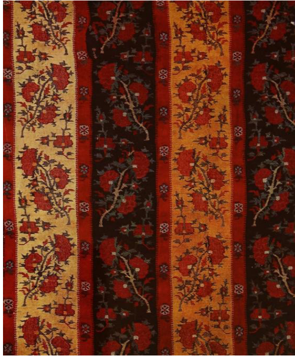
شکل ۴: ترمه با طرح محرمات (عناویان، ۱۳۵۴، ص ۹۷)

محرمات سیاه و سفید را می توان نام برد (زکریایی کرمانی، ۱۳۸۸، ص ۱۵۷).