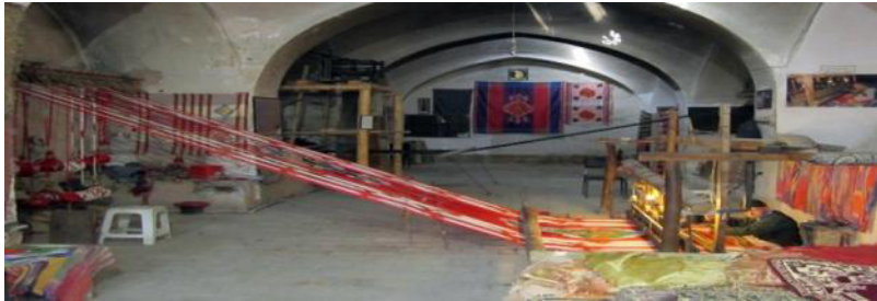
شکل ۸: ترمه و دارایی بافی خجسته، یزد

با سقوط صفویه و ورود ماشین‌های صنعتی جدید، هنر ترمه بافی نیز رو به افول نهاد. چنانچه امروزه جز کارگاه‌های معدودی که بیشتر حکم میراث فرهنگی ایران را دارد، نشانه‌ای از این هنر پررونق گذشته، مشاهده نمی‌شود. امروزه کارخانه‌های صنعتی به کمک کارخانه‌های نیمه صنعتی آمده و می‌توان با این دستگاه‌ها طرح‌های جدیدی به وجود آورد. هم‌اکنون مراکز مهم تولید پارچه‌های دست‌بافت ایران، استان‌های یزد، خراسان، مازندران، گیلان و خوزستان می‌باشد (شکل ۸). هنر ترمه‌بافی یکی از صنایع دستی استان یزد و کرمان محسوب می‌شود که شکل سنتی آن در کارگاه‌های اداره کل هنرهای سنتی وابسته به سازمان حفظ میراث فرهنگی آموزش داده می‌شود (شکل ۹).