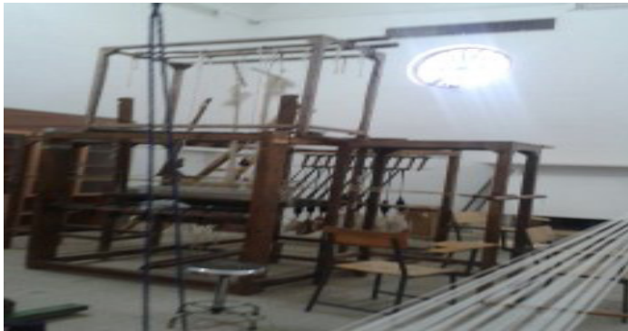
شکل ۹: کارگاه ترمه بافی، اداره کل میراث فرهنگی یزد