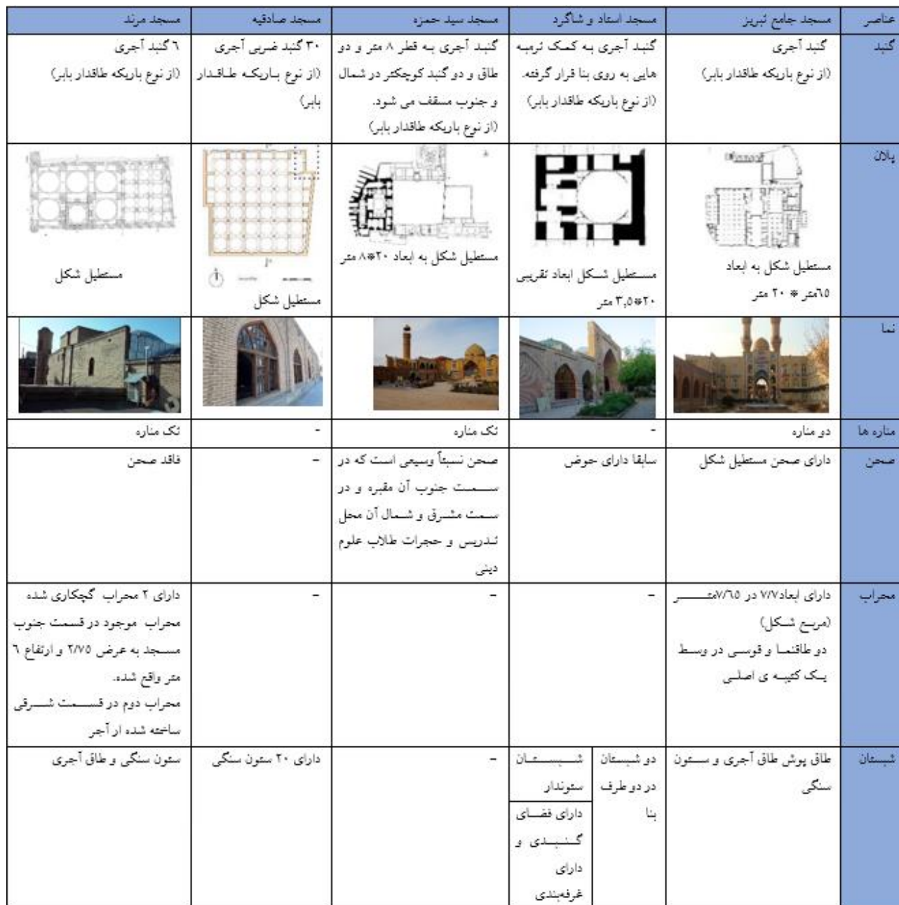
جدول ۱- مطالعات و بررسی مساجد ایلخانی تبریز

مرمت‌های انجام‌گرفته بر روی این بنا و در دوره قاجار، بخشی از تزیینات گچ‌بری محراب در نمازخانه قدیمی پوشانده شده بود. در جدول زیر خلاصه‌ای از مطالعات و بررسی مساجد ساخته‌شده در دوره ایلخانی آورده شده است.