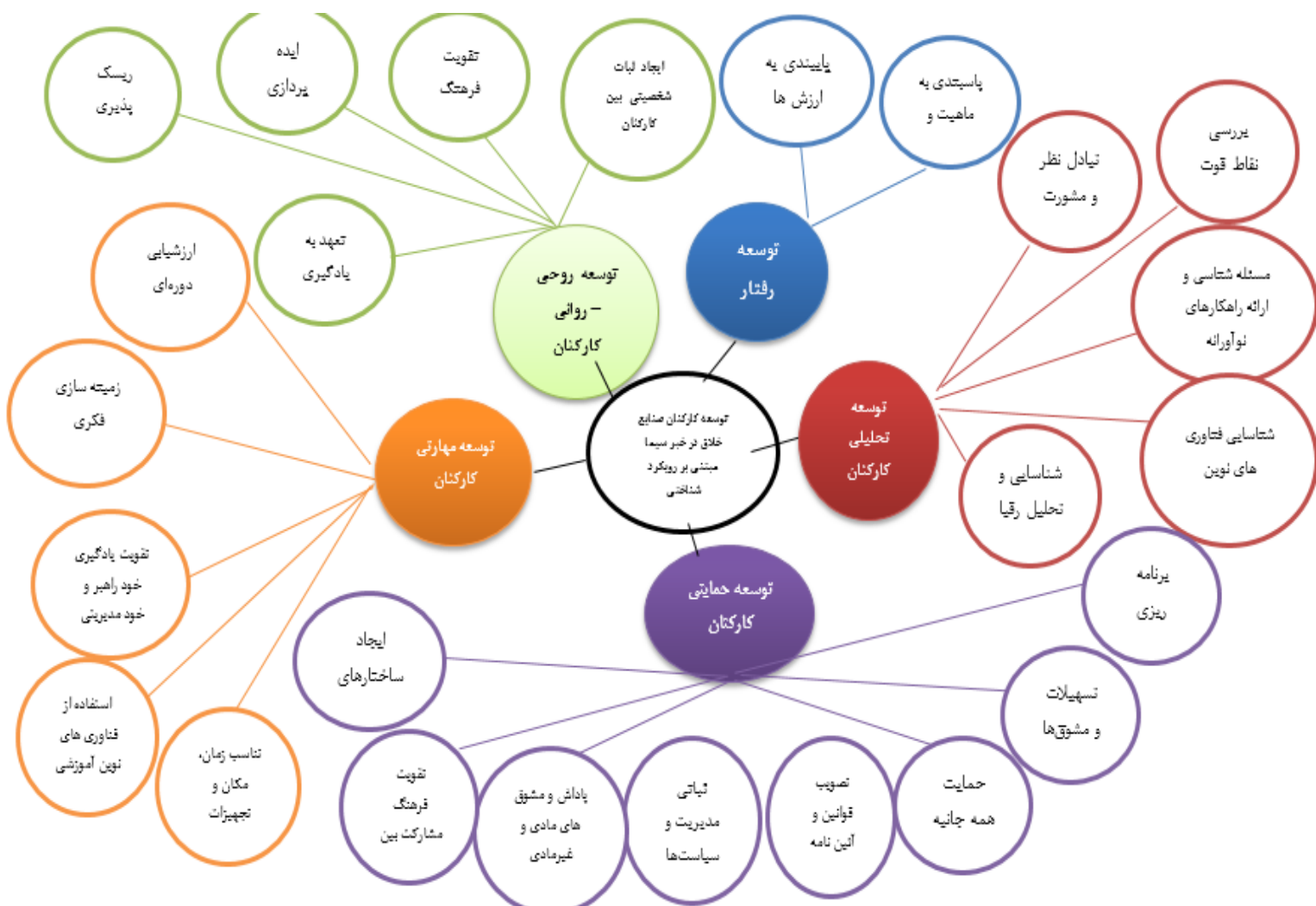
شکل ۲. ابعاد شناسایی شده جهت توسعه کارکنان صنایع خلاق در خبر سیما مبتنی بر رویکرد شناختی (برگرفته از کدگذاری باز و محوری)