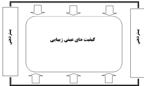
شکل ۱: رابطه بین پیش‌زمینه‌های ذهنی و کیفیت‌های عینی زیبایی (ماخذ: نگارندگان)

نظاره‌گر، مانند خاطرات و دیگر فاکتورهای تاثیرگذار بر ذهنیت انسان، بستری ذهنی برای ادراک زیبایی‌ها فراهم می‌کند که در این بستر شرایط برای ادراک پدیده‌های طبیعی و ماهیت کالبدی آن فراهم است؛ به عبارت دیگر ذهنیت و پیش‌زمینه‌های ذهنی موجود در ارتباط با محیط همچون بستری می‌باشند که زیبایی‌های مادی را تحت تاثیر قرار می‌دهد و کیفیت‌های زیبایی‌شناسی را در دیدگان ناظر شکل می‌دهد. شکل ۱ این مطلب را به شکل گرافیکی نشان می‌دهد.