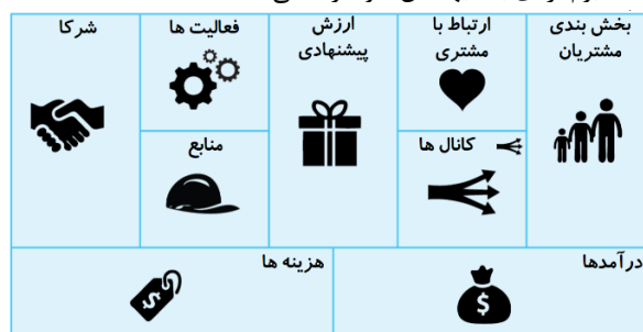
شکل ۳- لایه اقتصادی مدل کسب و کار [۳۱]

ارزش پیشنهادی. این جزء پاسخی اقامتگاه بوم‌گردی به نیاز میهمان است و علتی است که گردشگر، یک اقامتگاه بوم‌گردی را نسبت به سایر اقامتگاه‌ها ترجیح می‌دهد. ارزش پیشنهادی نیازهای گروه خاصی از گردشگران را تأمین می‌کند. بنابراین مجموعه‌ای از مزایا و منافع است که اقامتگاه بوم‌گردی به میهمانان خود ارائه می‌دهد.