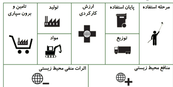
شکل ۴- لایه محیط‌زیستی مدل کسب و کار [۳۱]

تأمین و برون‌سپاری. این جزء نشان‌دهنده تمام فعالیت‌های تأمین مواد و محصولات دیگری که اقامتگاه بوم‌گردی برای دستیابی به ارزش کاربردی نیاز دارد، ولی در فعالیت‌های کلیدی در نظر گرفته نشده است.