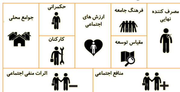
شکل ۵- لایه اجتماعی مدل کسب و کار [۳۱]

فرهنگ جامعه. این جزء به‌عنوان تأثیرات بالقوه اقامتگاه بوم‌گردی بر جامعه شناخته می‌شود. این مفهوم تداعی‌کننده آن است که وقتی جامعه شکست می‌خورد و زیان می‌کند، اقامتگاه بوم‌گردی در آن جامعه نمی‌تواند موفق شود. این جزء مفهوم ارزش پایدار را از طریق تأکید تأثیر بالقوه اقامتگاه بوم‌گردی بر جامعه ارتقاء داده و چگونه این اقدامات اثرات مثبت خود را بر جامعه می‌گذارد.