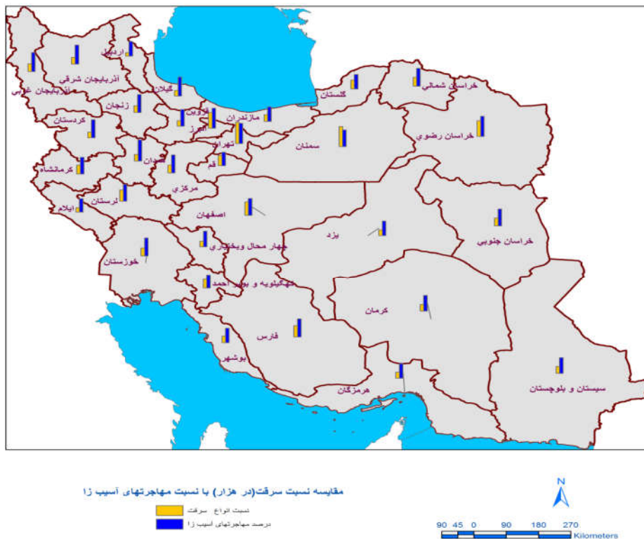
شکل ۳: مقایسه‌ی میزان مهاجرت‌های آسیب‌زا و وقوع سرقت در هر هزار نفر