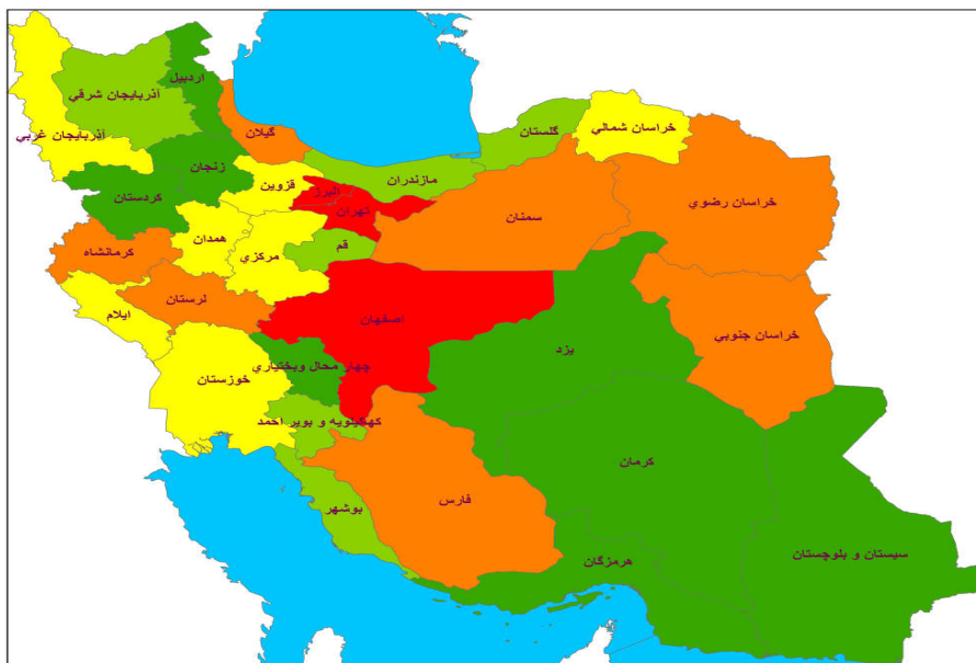
شکل ۴: پهنه‌بندی استان‌های کشور برحسب ضریب ناامنی محیط اجتماعی