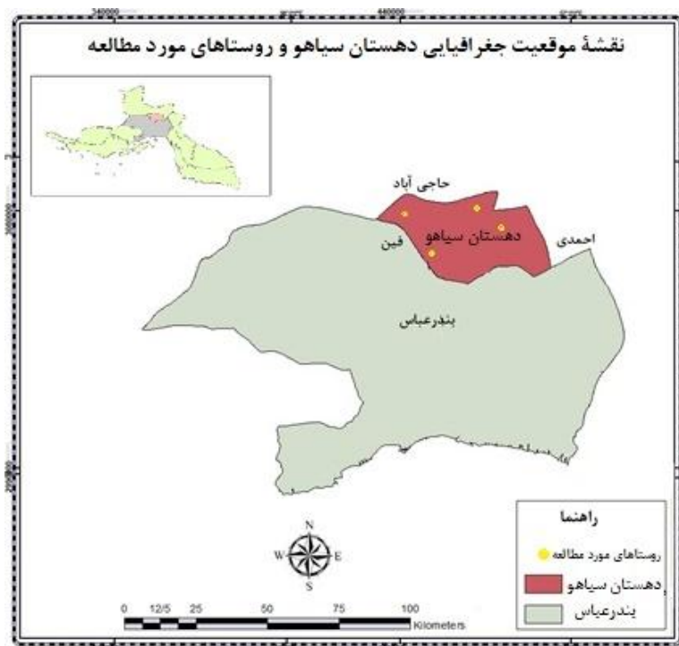
نقشه ۱. موقعیت جغرافیایی دهستان سیاهو و روستاهای مورد مطالعه