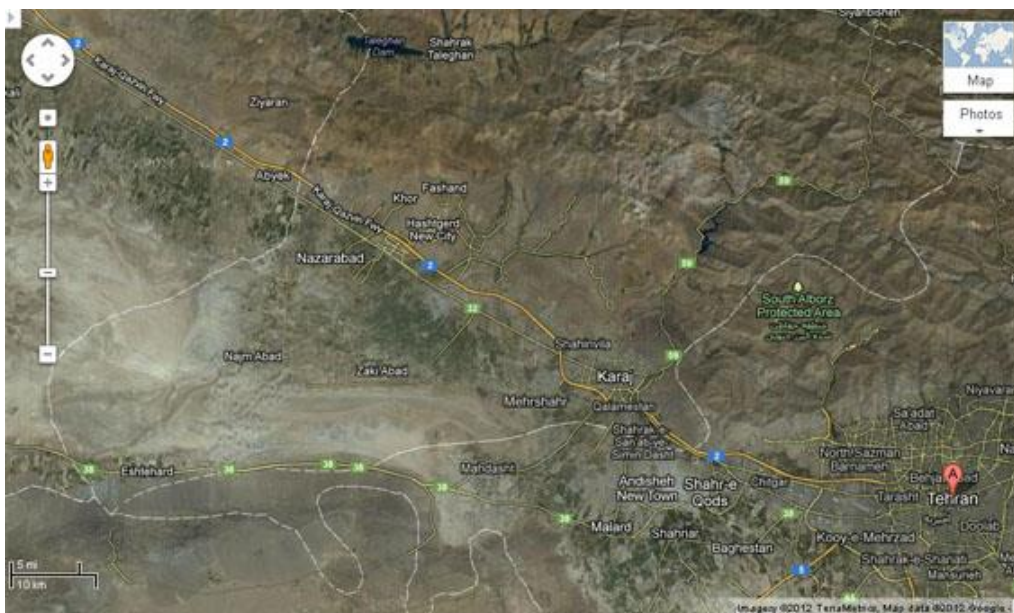
نقشه هوایی شهر جدید هشتگرد