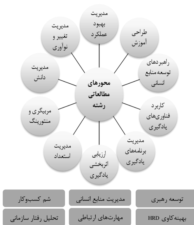
شکل ۲: محورهای مطالعاتی رشته آموزش و توسعه منابع انسانی

در این پژوهش، پس از سه مرحله مطالعه و جستجو در منابع و پیشینه موضوع، بررسی برنامه‌های درسی دانشگاه‌های برتر دنیا و نیز مصاحبه با صاحب‌نظران و متولیان آموزش و توسعه منابع انسانی، ابعاد ذیل به عنوان مهم‌ترین حوزه‌های مطالعاتی این رشته شناسایی گردید.