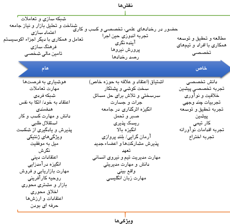
شکل (۲). طیف خاص بودن ویژگی‌ها و نقش‌های کارآفرینان فناور