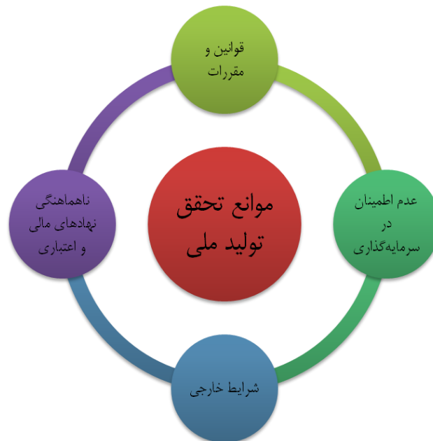
شکل ۲ موانع تحقق تولید ملی