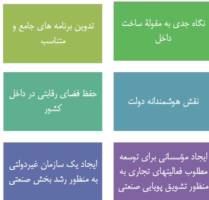
شکل ۱ عوامل کلیدی رشد صنعت در نروژ

در پژوهش هاشمی و همکارانش (Hashemi, Nahidi & Abadi, 2012) مدل علمی حمایت دولت از تولید داخلی و افزایش درآمد در بنگاههای اقتصادی ارائه شده است. این الگو تلفیقی از تئوری های علم مدیریت، مدیریت تولید و اقتصاد و مهندسی صنایع است که در آن از مدل های توسعه، مزیت نسبی و روش دلفی و روش کارت های متوازن و مدل چرخه های تولید بهره جسته و تلفیقی از همه آنها در یک مدل توسعه بومی و متناسب با ساختار اقتصاد دولتی ایران ارائه شده است.