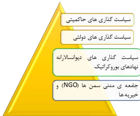
نمودار ۲: گونه‌شناسی جزئی سیاستگذاری‌های داخلی پیرامون کودک در ایران