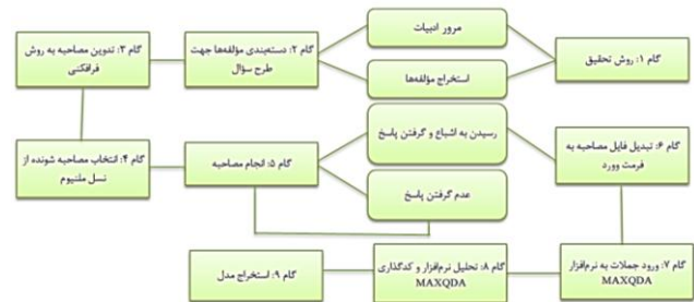
نمودار ۱- مراحل روش تحقیق کیفی

مفهوم‌پردازی خاصی دیده نشده و نبود مقیاس و مؤلفه‌های جدید، این تحقیق از نوع کیفی می‌باشد و سعی در شناسایی مؤلفه‌های جدید بازاریابی ویروسی برخط دارد که شامل بخش‌های متفاوتی می‌باشد و طبق نمودار شماره (۱) نشان داده می‌شود. در بین روش‌های انجام تحقیق کیفی از تکنیک فراقنی ۱ استفاده شده است. تکنیک‌های فراقنی که در ابتدا توسط روانشناسان بالینی مورد توجه و توسعه پیدا کرد، بعداً برای استفاده در تحقیقات مصرف‌کننده و تحقیقات بازاریابی توسط محققان بازاریابی مورد اقتباس قرار گرفت. چون تحقیق حاضر در مورد بازاریابی ویروسی برخط بوده و یک نوع اثرگذار آن بازاریابی دهان به دهان می‌باشد بنابراین براساس این نوع از بازاریابی ۹۲٪ از مصرف‌کننده‌ها، پیشنهادهای دوستان یا خانواده‌شان را بیشتر از هر نوع دیگری از تبلیغات باور می‌کنند. تنها نوع بازاریابی که بر پایه تفکر واقعی مشتری نسبت به برند یک شرکت باشد بازاریابی دهان به دهان است، این بازاریابی صادقانه‌تر از انواع دیگر بازاریابی است، پس بر این اساس به جهت دست‌یافتن به داده‌ها و اطلاعات دقیق‌تر که به واقعیت نزدیک‌تر باشد در حوزه رفتار مصرف‌کننده و بازاریابی از روش فراقنی استفاده شده است. روش‌های فراقنی را بسته به میزان اطلاعاتی که تولید می‌کنند به سه دسته تقسیم می‌کنند: تداعی کلمات ۲ ، تکمیل جملات ۳ و تمرینات رویا ۴ .